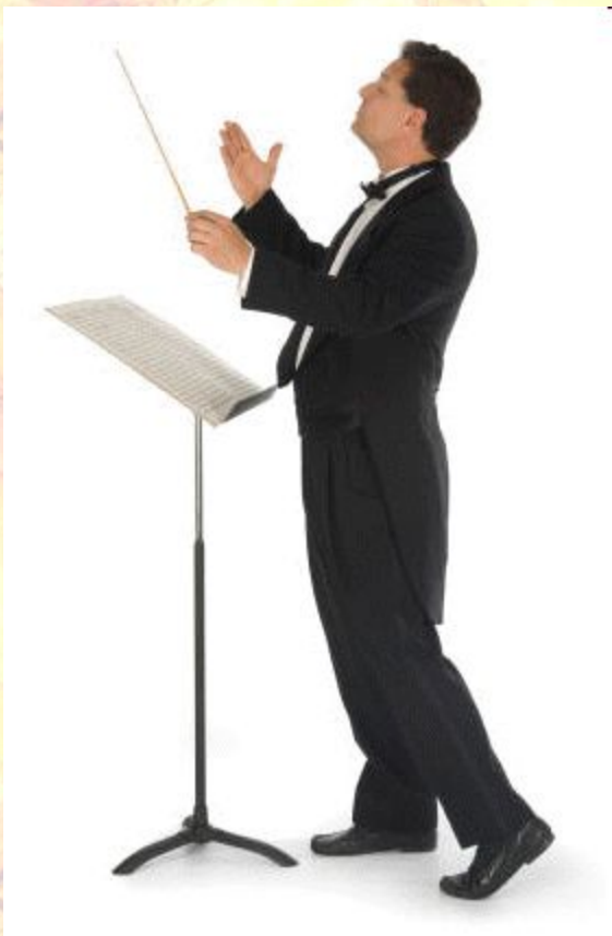
Abb. 78. Dr. Hanß v. Bülow bei der Arbeit von Schließmann. Aus dem „Figaro“, 1884.