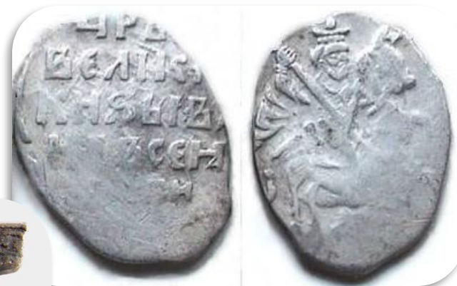
Копейка с 1554г.