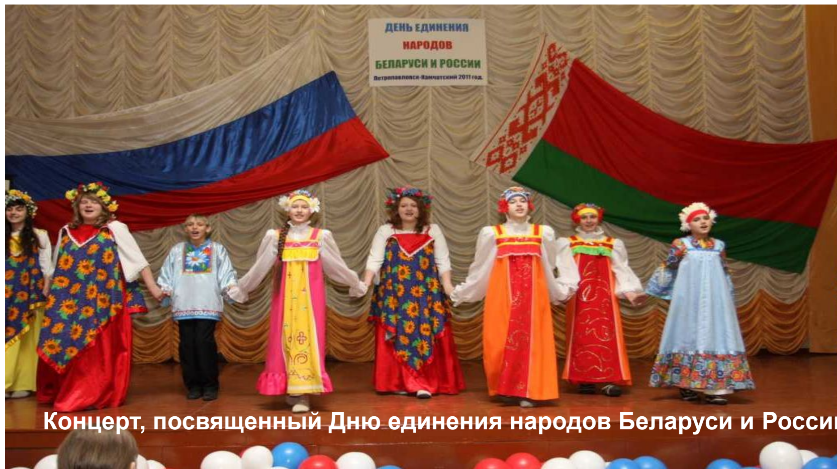
Концерт, посвященный Дню единения народов Беларуси и России

В России и Беларуси проходят праздничные мероприятия, посвященные единению двух государств