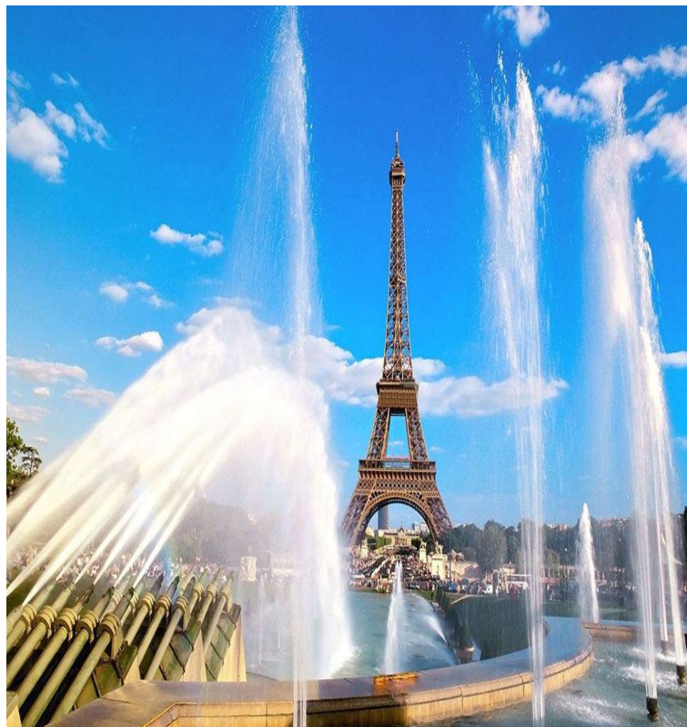
Париж- столица Франции. Эйфелева башня