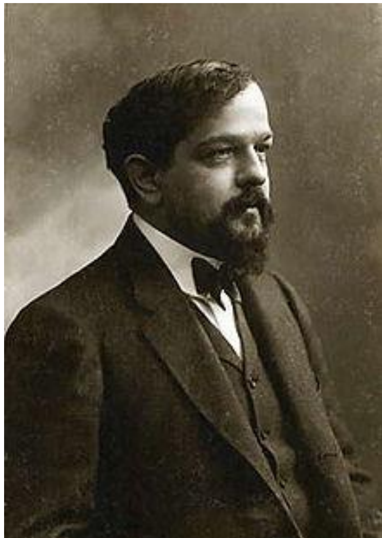
КЛОД ДЕБЮССИ 1862-1918