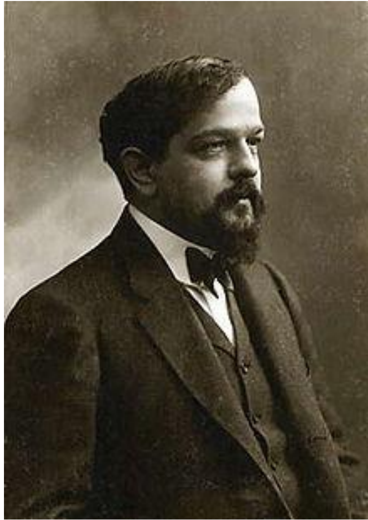
КЛОД ДЕБЮССИ 1862-1918