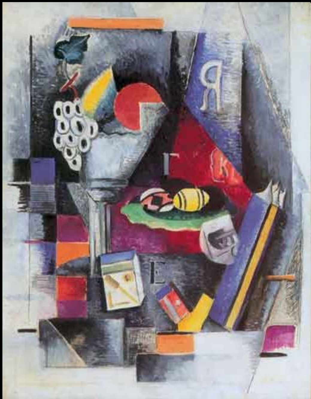
А. Экстер Натюрморт с яйцами. 1914