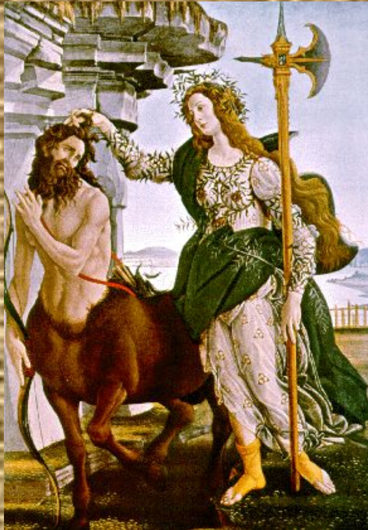
Афина Паллада и кентавр