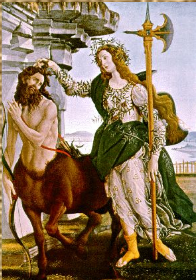
Афина Паллада и кентавр