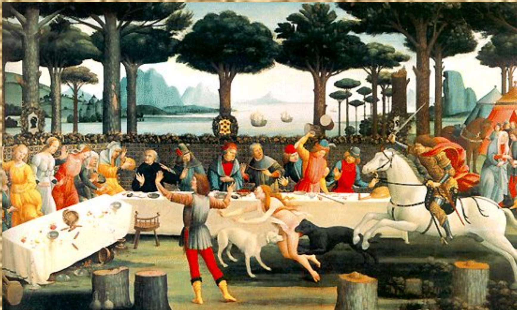
История Настаджо дельи Онести