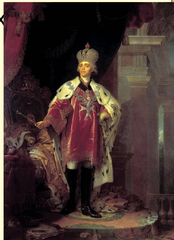
Портрет императора Павла I