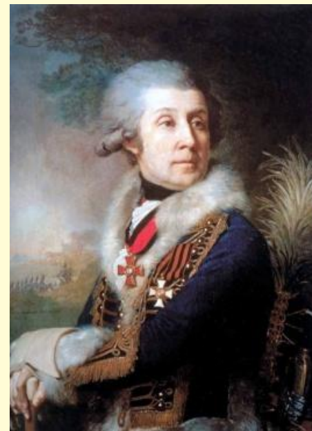
Портрет Ф.А. Боровского