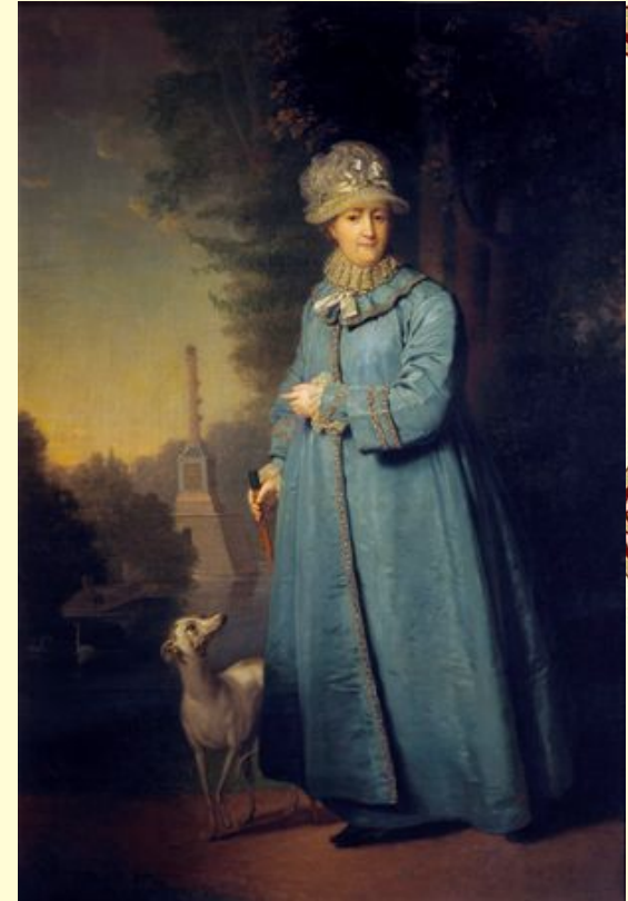
«Екатерина II на прогулке в Царскосельском парке»