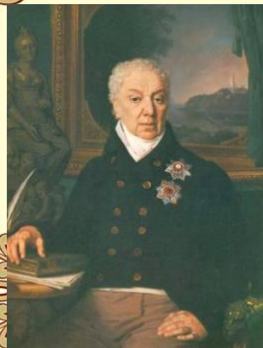
Портрет Д.П. Троцинского