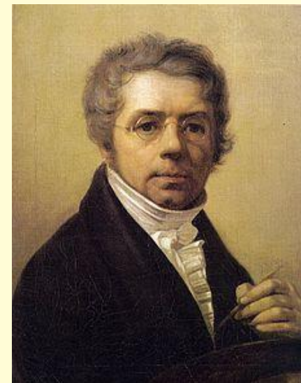
Ученик Боровиковского – художник А. Г. Венецианов