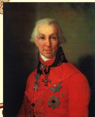
Портрет Г.Р. Державина