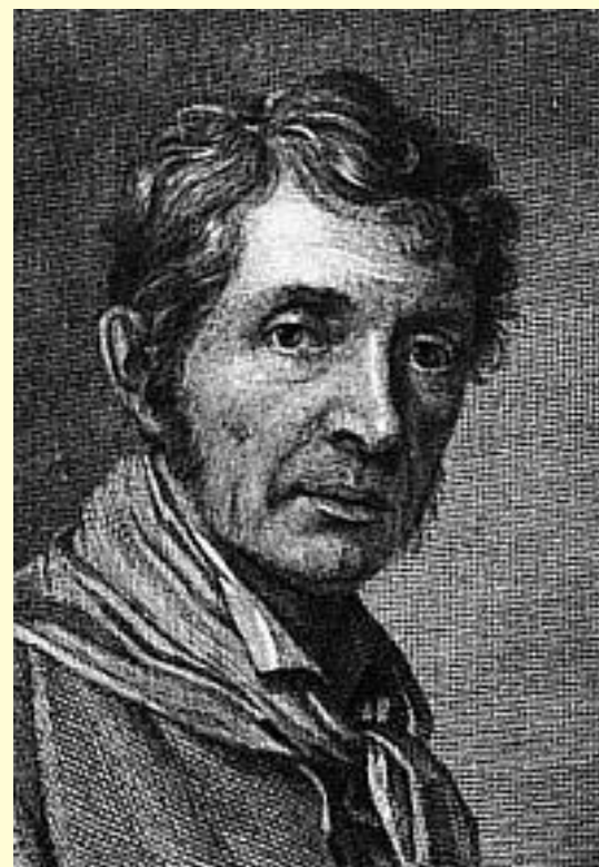
Учитель Боровиковского – художник И.Б. Лампи