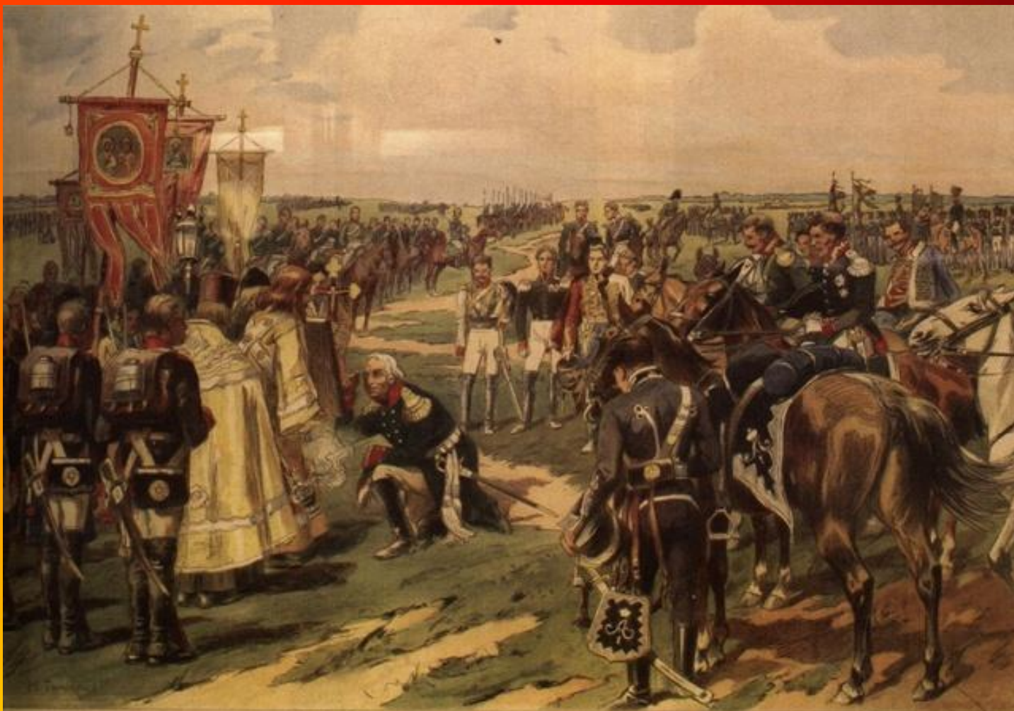
Кутузовъ молебствуетъ войскамъ 25 Августа 1812 года.