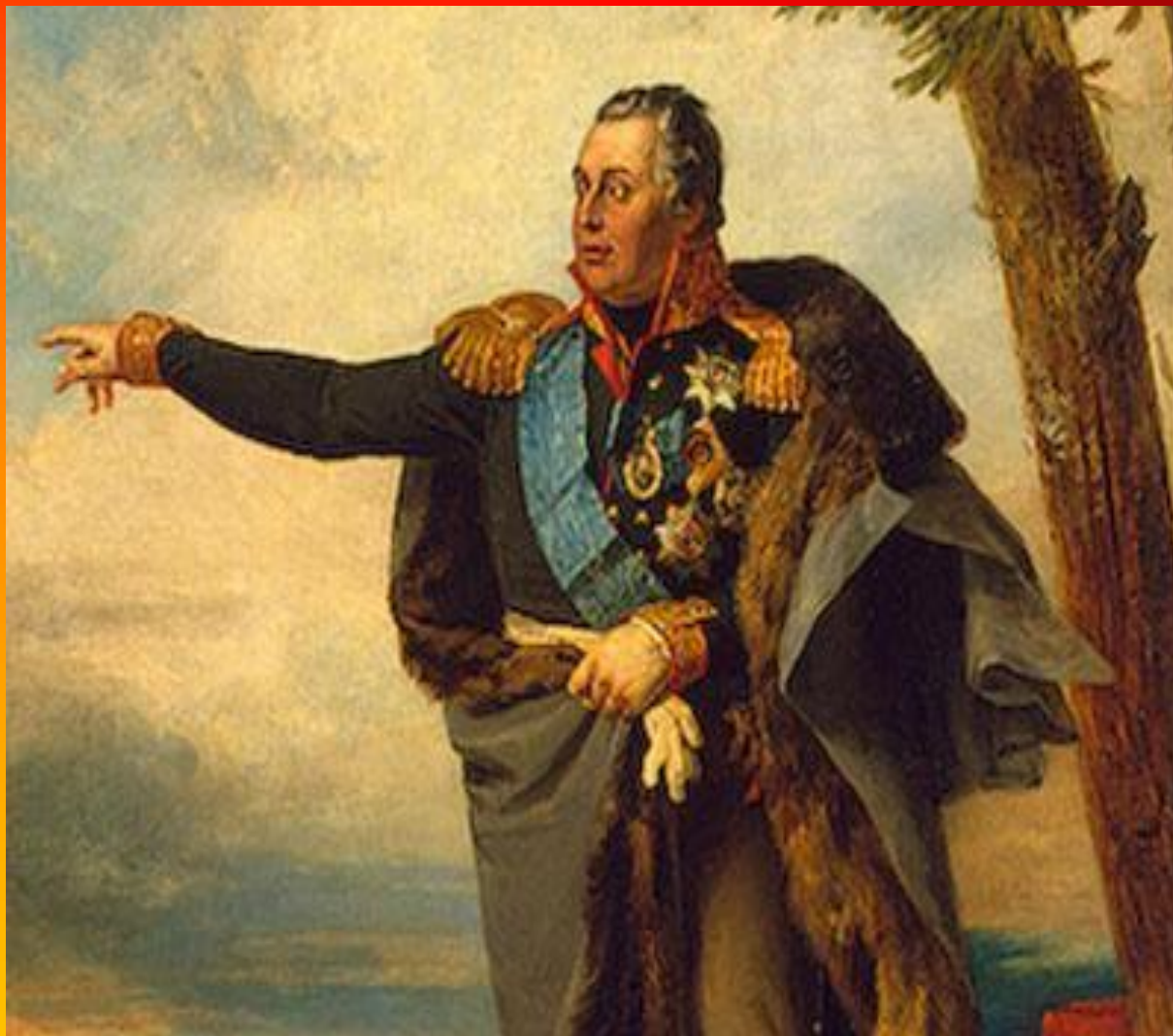
Генерал-фельдмаршал князь Михаил Илларионович Голенищев-Кутузов-Смоленский. Дж. Доу. 1829 г.