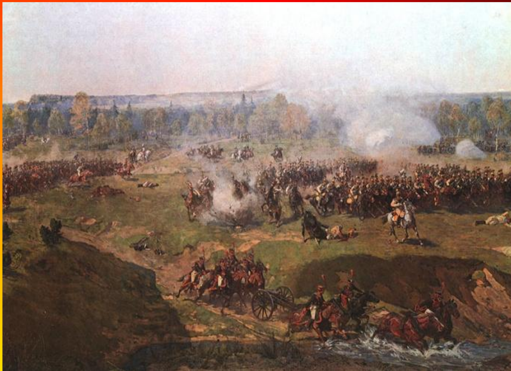
Ф.А.Рубо. Атака саксонских кирасир