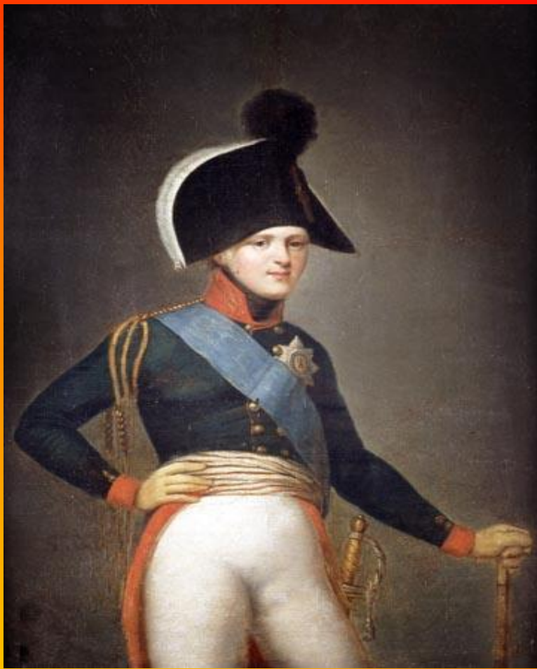
Портрет Императора Александра I. Кюгельхен Г. 1801.