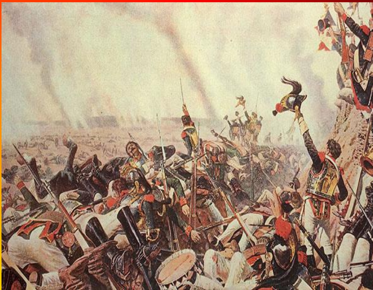
Верещагин В.В. Конец Бородинского сражения