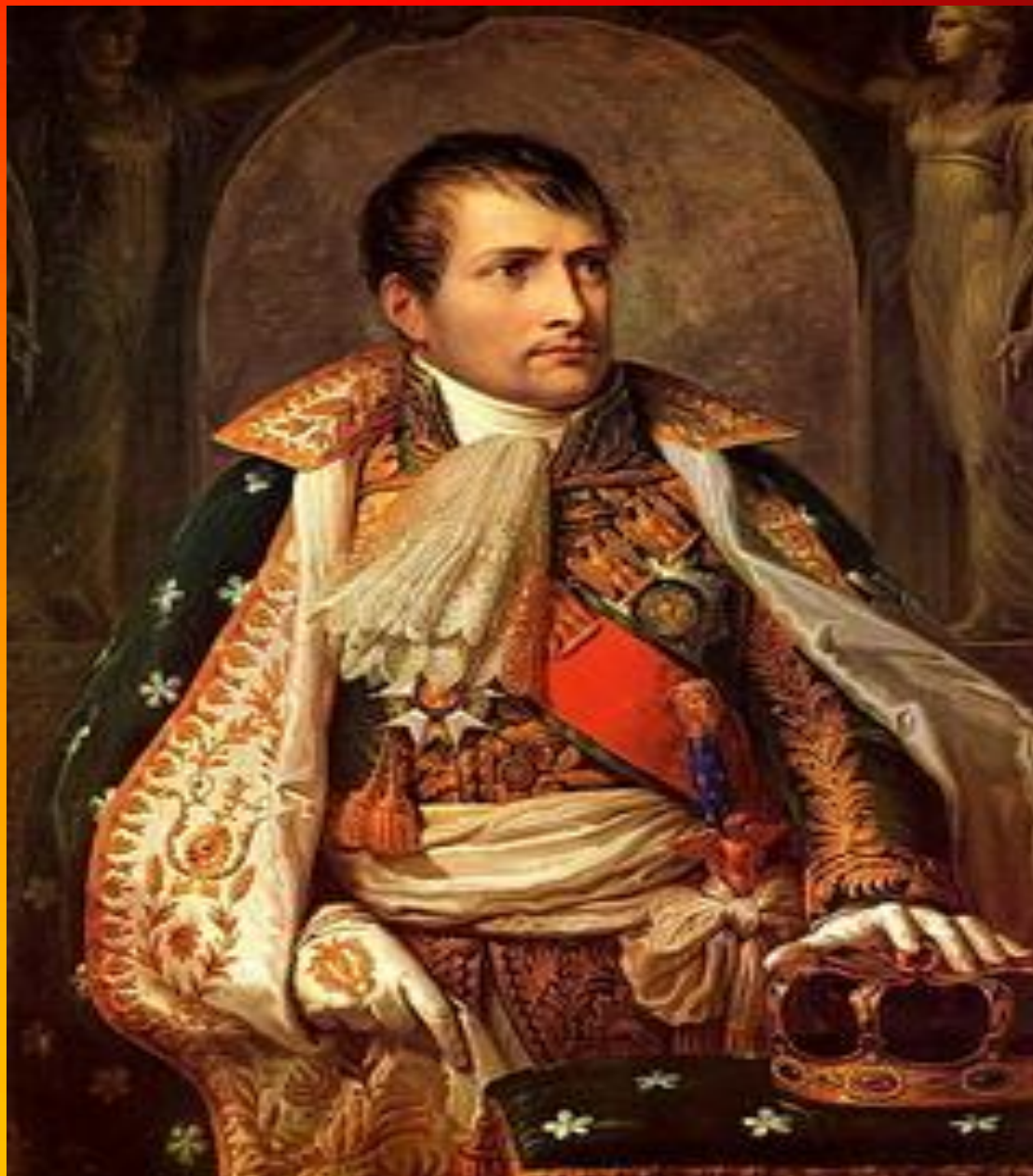
Аппиани Андреа. Портрет Наполеона.