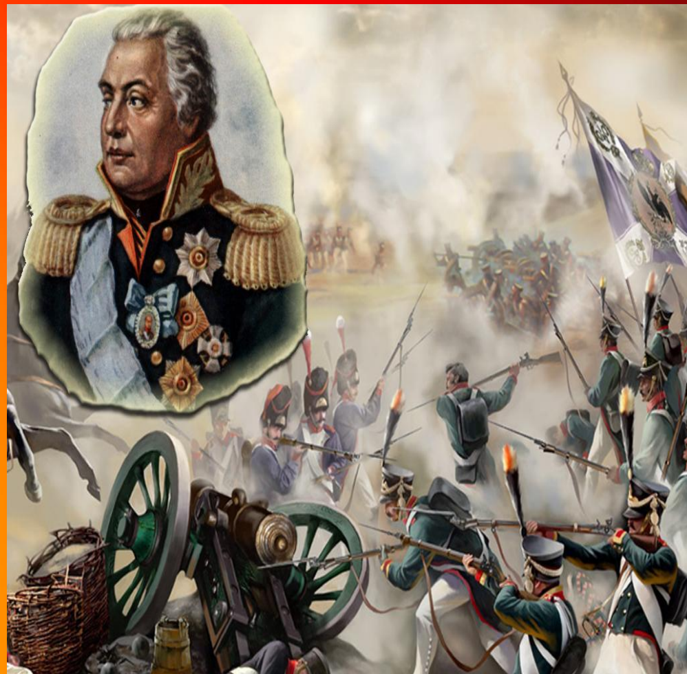
Портрет генерал-фельдмаршала М.И.Голенищева-Кутузова Волков Р.М. 1813 г.