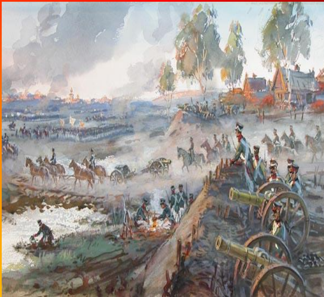
Рисунок В.Г.Шевченко. Бородино.