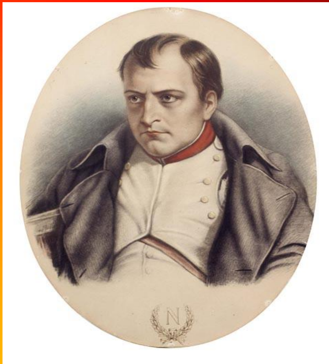
Рисунок неизвестного художника с картины Деляроша . «Наполеон в Фонтенбло».