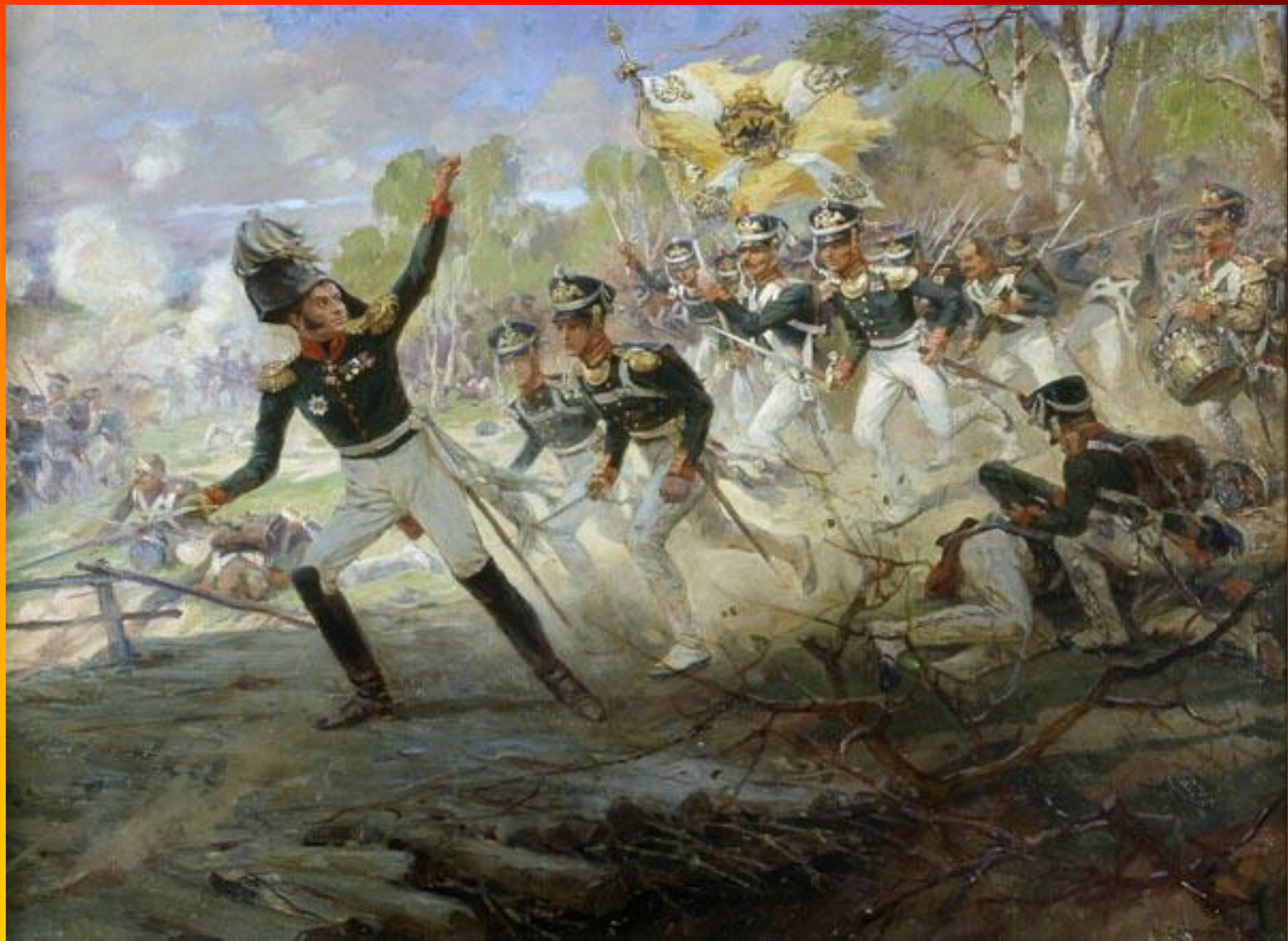
Самокиш Н.С. Подвиг солдат Раевского под Салтановкой