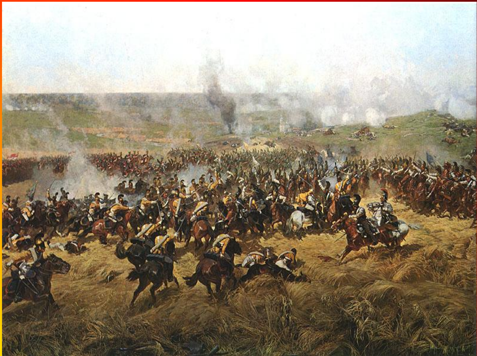
Ф.А.Рубо. Кавалерийский бой во ржи.