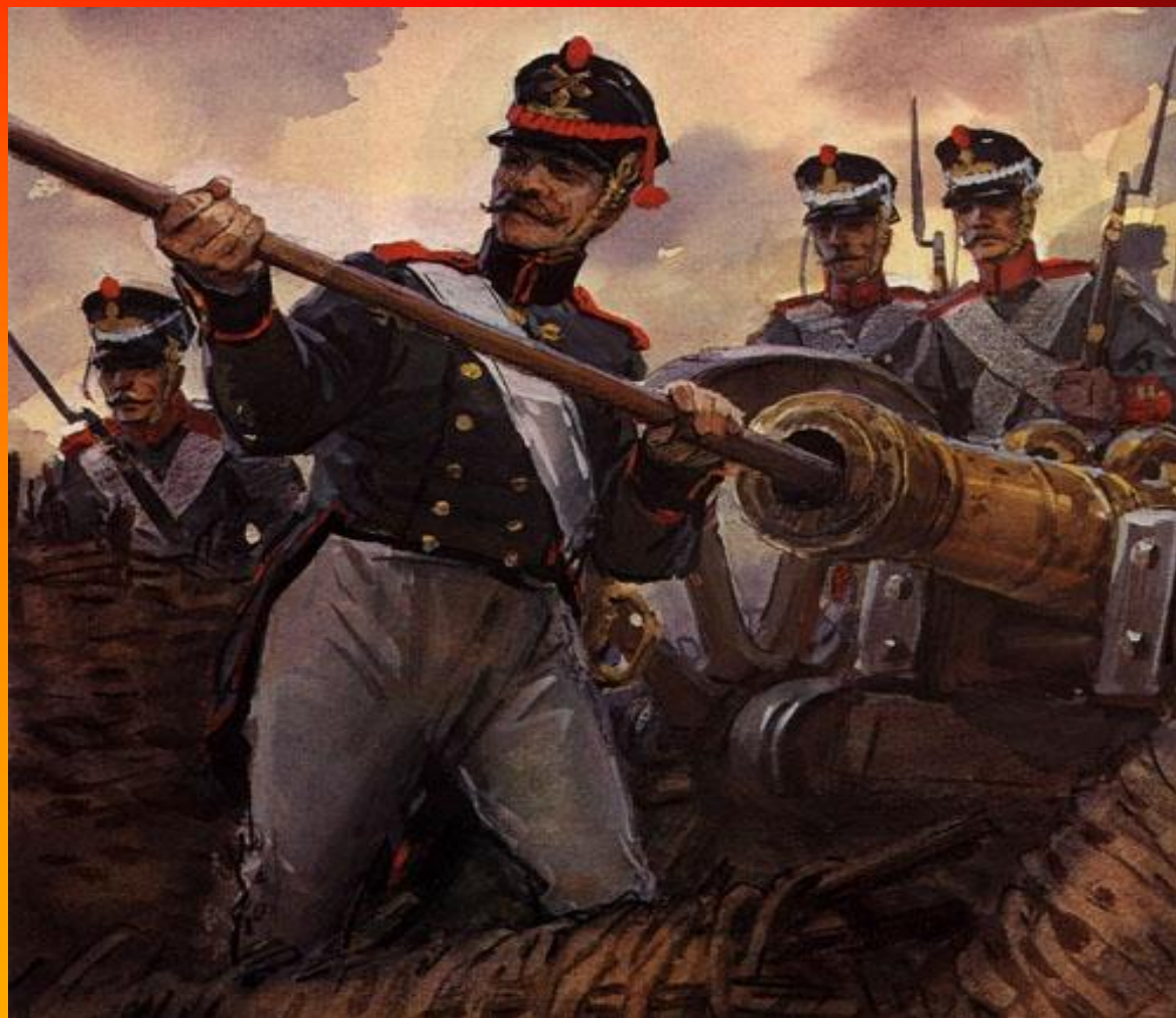
Рисунок Шевченко В.Г. Бородино.

Забил заряд я в пушку туго И думал: угощу я друга! Постой-ка, брат мусью! (Лермонтов М.Ю. Бородино)