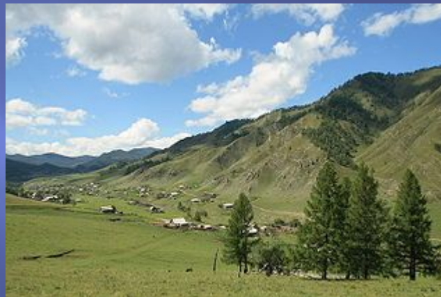
Вид села Верхняя Апшухта