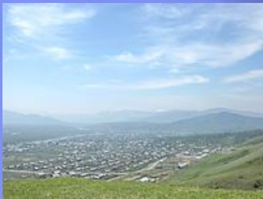
Вид на село с Теректинского хребта