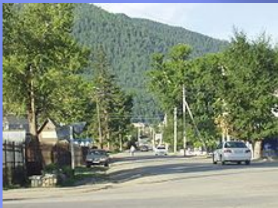
На улицах Онгудая