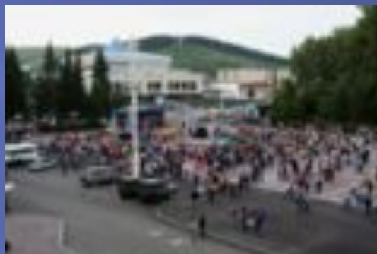
Празднование 250-летия вхождения Алтая в состав России на площади им. В. И. П.