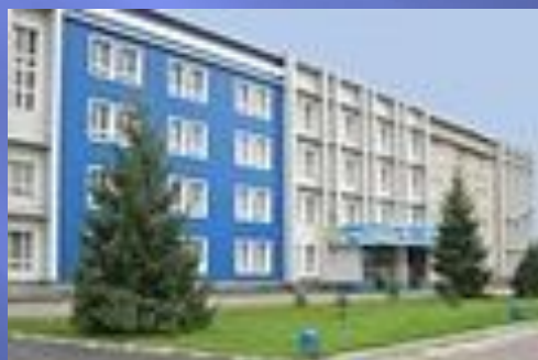
Горно-Алтайский государственный университет