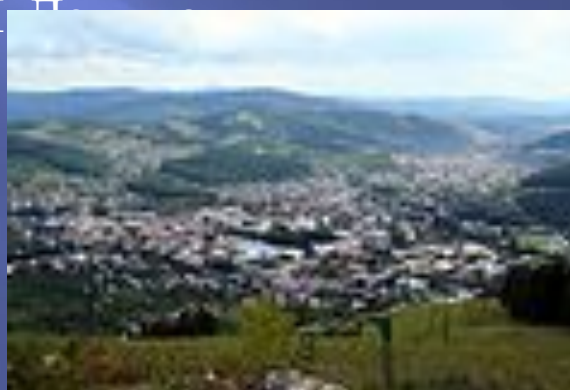
Панорама Горно-Алтайска, вид с горы Тугая