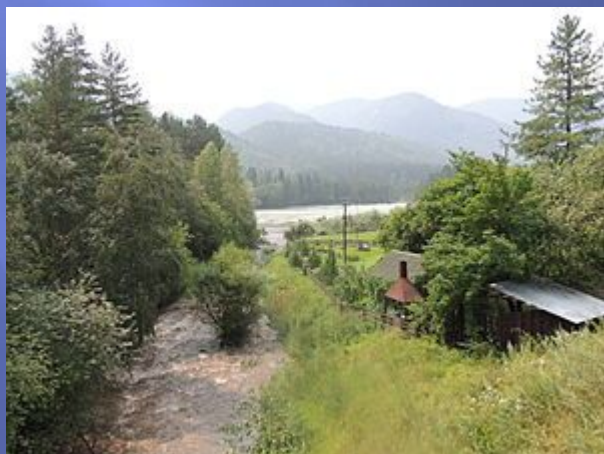
Впадение реки Муны в Катунь, с. Усть-Муны