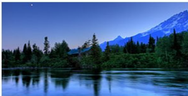
Thanksgiving from Photo Passion