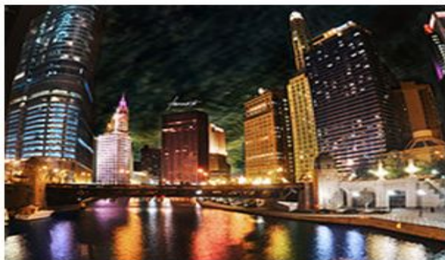
America The Beautiful // Happy... from Tomasito.!

View: Small | Medium | Detail | Slideshow