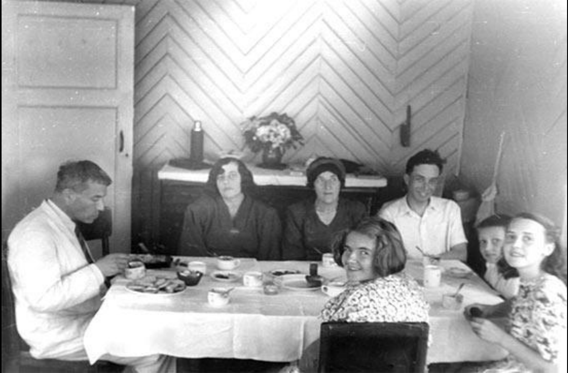
Борис Пастернак, Зинаида Пастернак, Наталья Блюмнефельд, Милица Нейгауз, Евгений Пастернак, Лёня Пастернак, Галина Нейгуз. Переделкино, 1948 г.