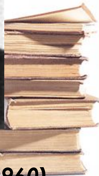
Пастернак Борис Леонідович (1890 - 1960)