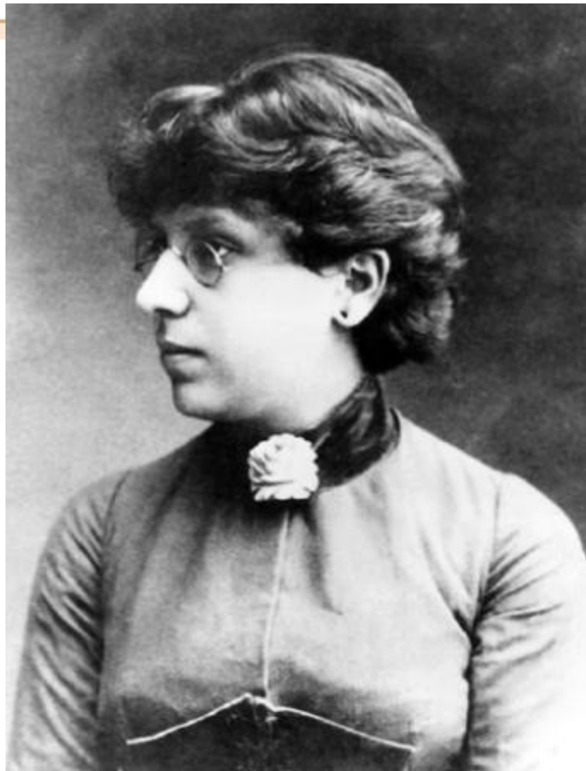
Фотография Р. И. Кауфман. 1888.