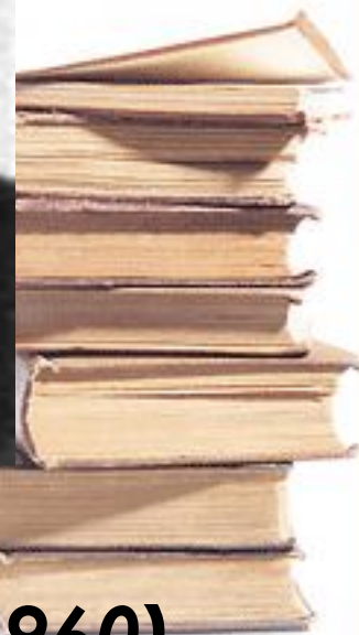
Пастернак Борис Леонідович (1890 - 1960)