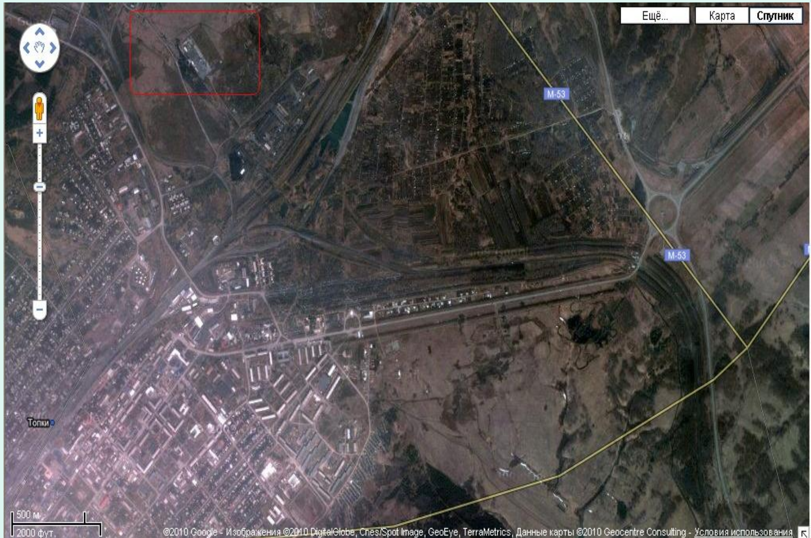
ФОТО со спутника