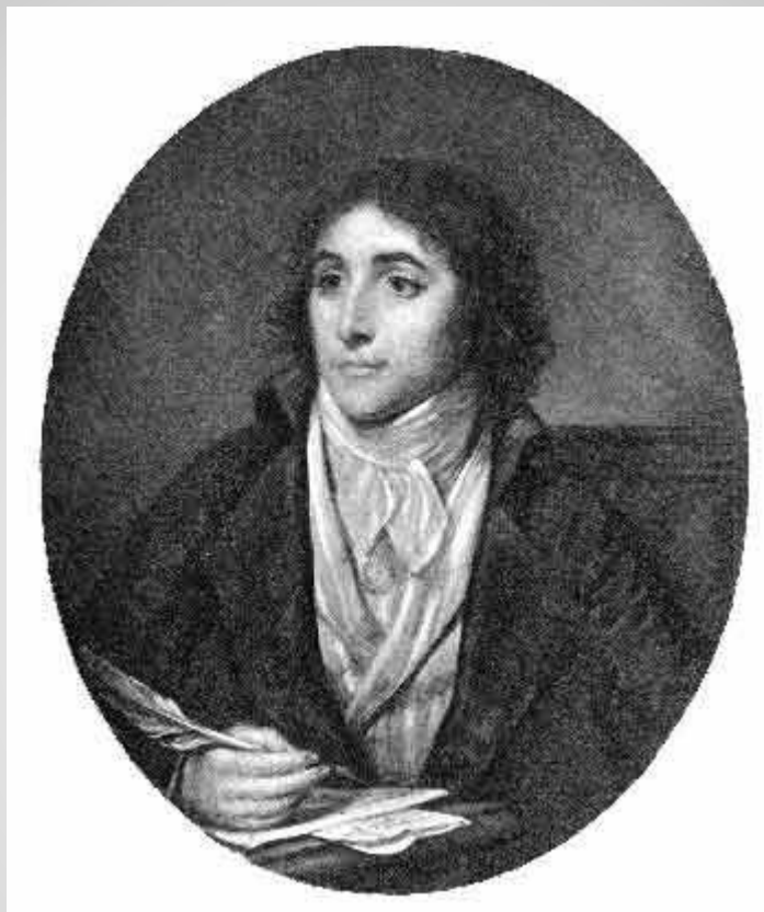
Жан Батист Грёз (1725-1805)