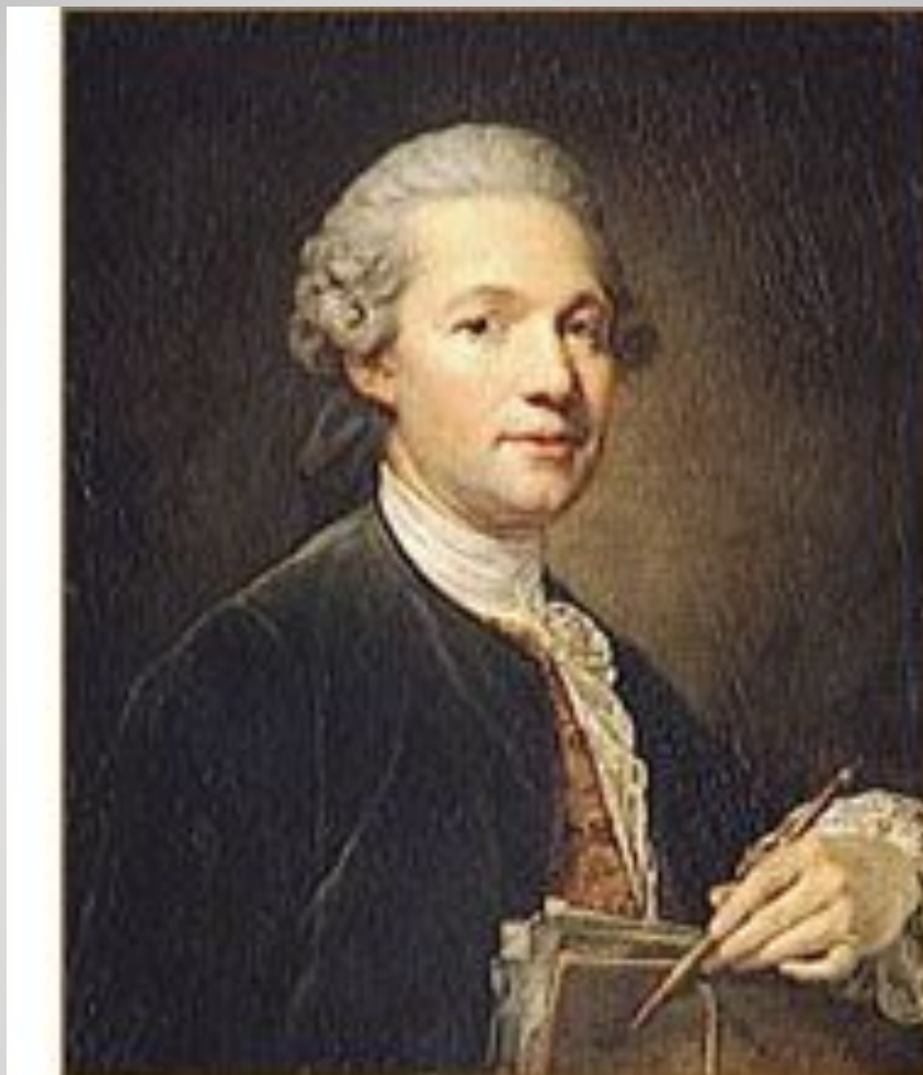
Жак Анж Габриэль