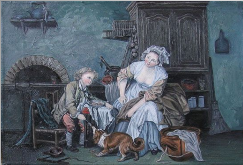
«Балованное дитя, или Плоды дурного воспитания»

«Паралитик, за которым ухаживают его дети, или Плоды хорошего воспитания»»,