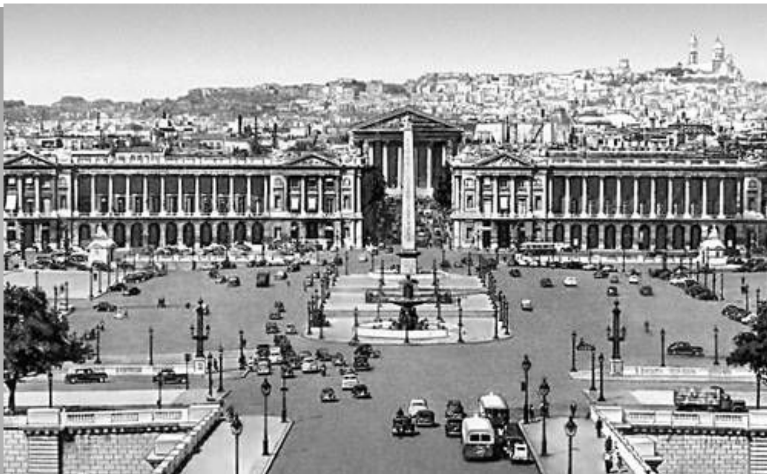
Площадь Согласия. 1753-75. Архитектор Ж. А. Габриель