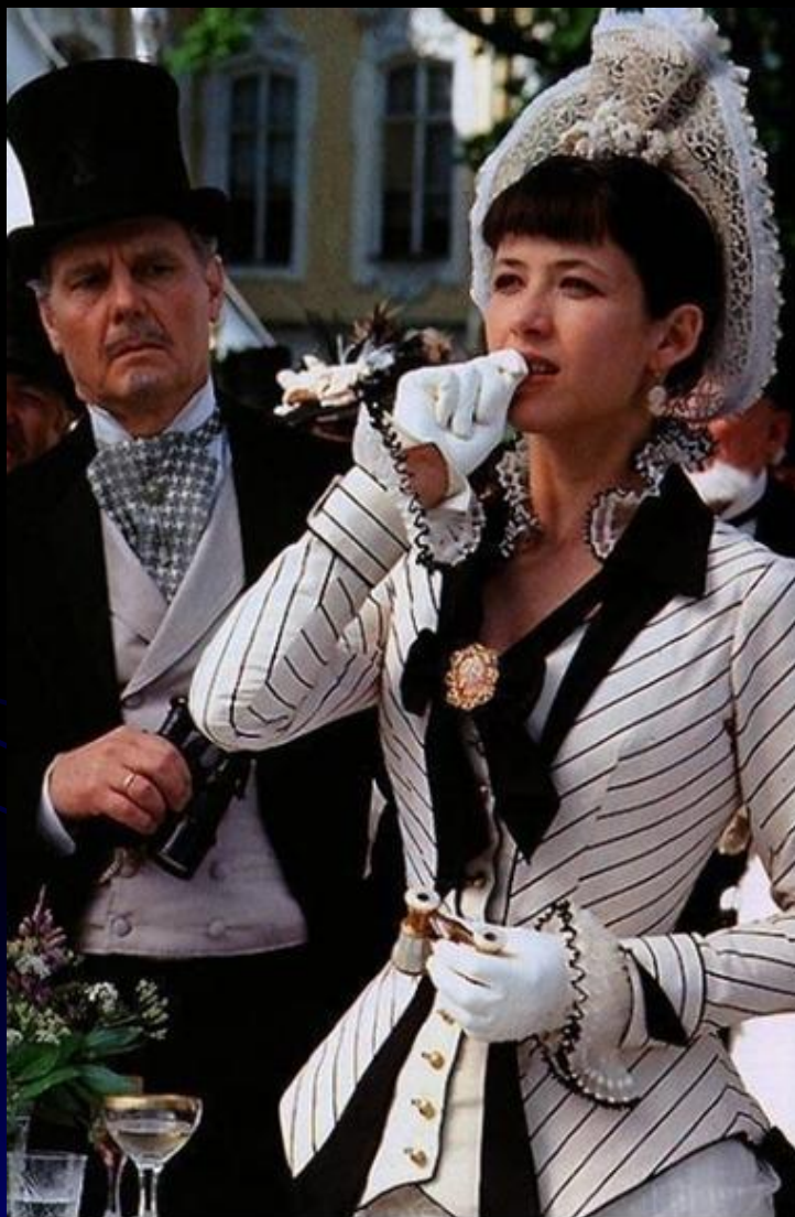
Софи Марсо в роли Анны Карениной