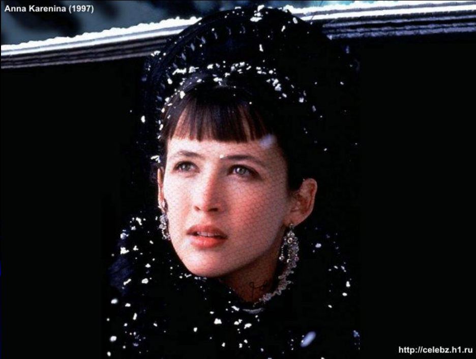
Anna Karenina (1997)