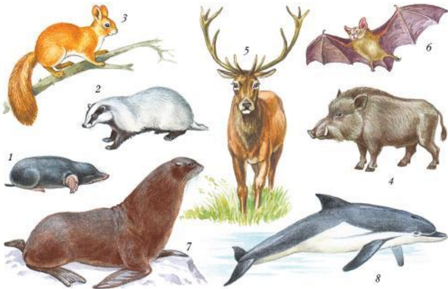
Рис. 219. Экологические группы зверей. I – роющие: 1 – крот; 2 – барсук; II – лесные: 3 – белка; 4 – кабан; 5 – благородный олень; III – летающие: 6 – летучая мышь; IV – плавающие: 7 – морской котик; 8 – дельфин