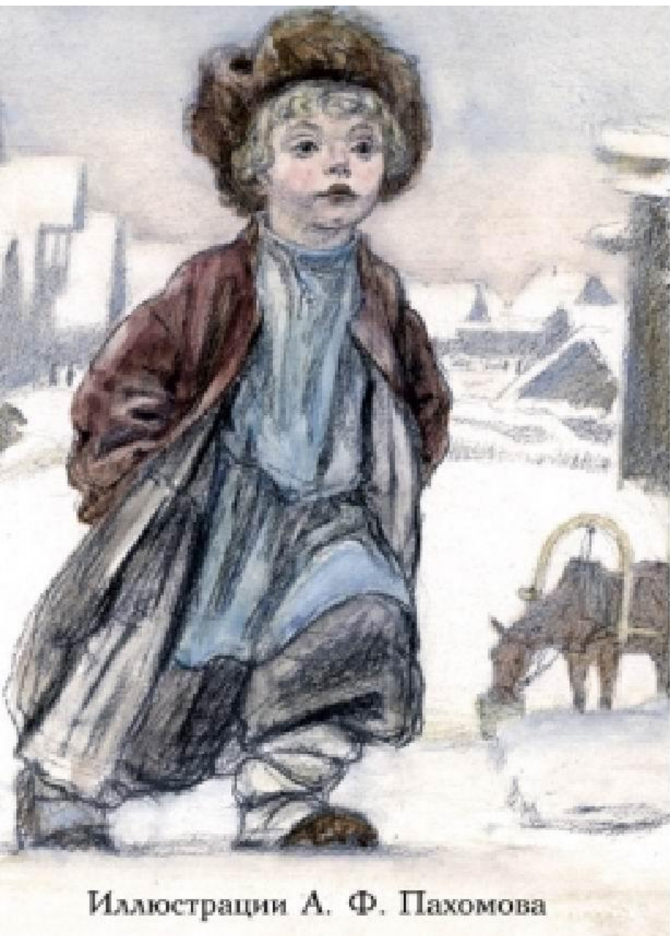
Иллюстрации А. Ф. Пахомова