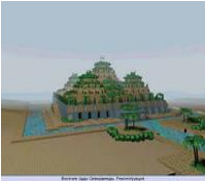
Beşinci Döner Çamaşhanası Projesiyle ilgili