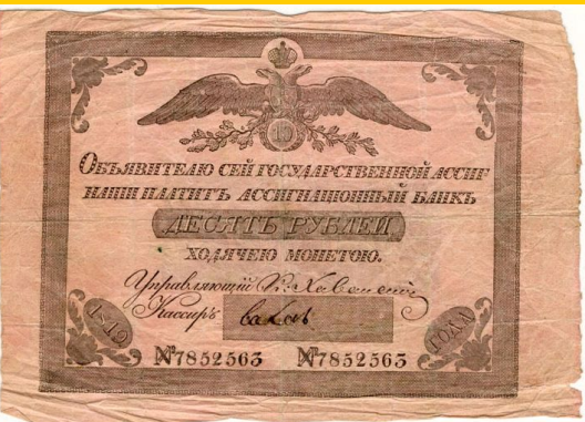
Ассигнация при Екатерине II