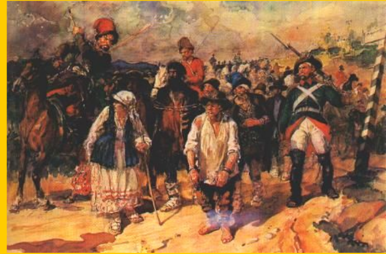
Г.Савицкий. «Пригон рабочих на уральский завод».