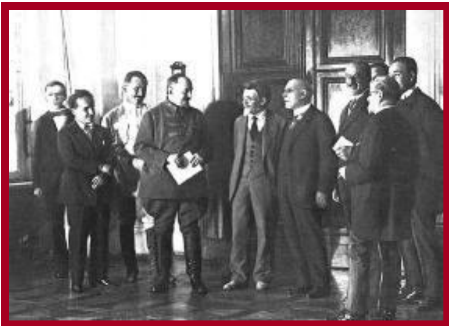
Подписание торгового договора с Грецией.