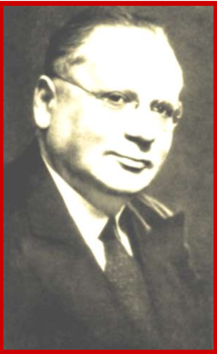
Нарком иностранных дел М.М. Литвинов

«Новый курс» советской дипломатии во многом был связан с деятельностью нового наркома иностраннных дел М.М. Литвиновым (1930-1939).