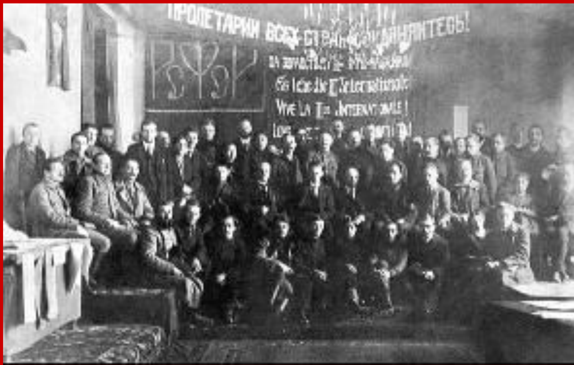
В.И.Ленин. Среди делегатов I конгресса Коминтерна.