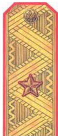
Генерал-майор (парадная форма одежды)