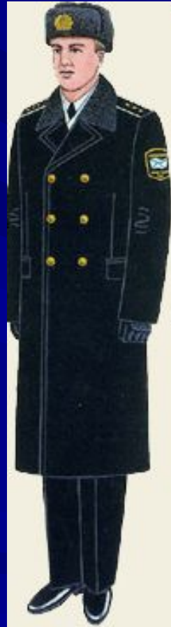
парадная для строя и вне строя