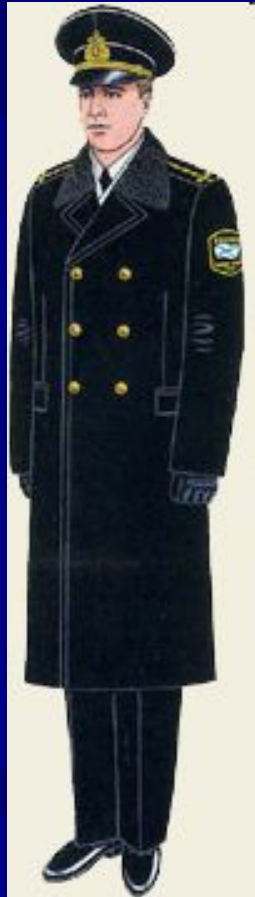
парадная для строя и вне строя