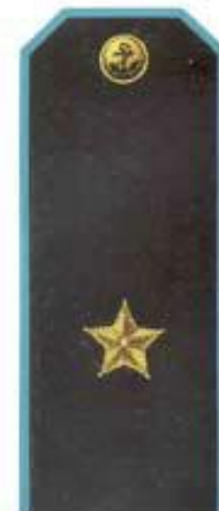
Генерал-майор (повседневная форма одежды, морская авиация)