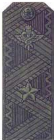
Генерал-майор (полевая форма одежды)