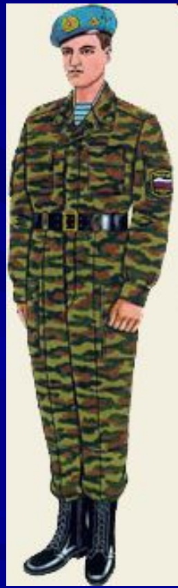
парадная для строя повседневная и вне строя ВДВ