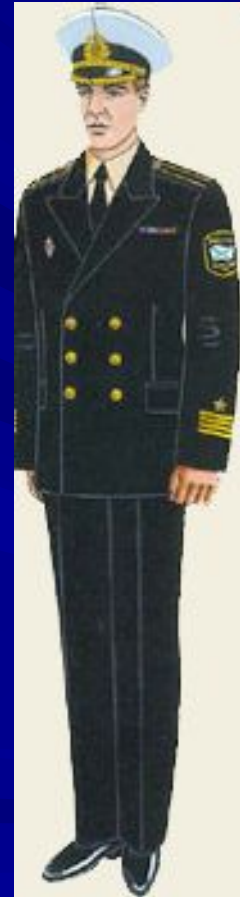
повседневная вне строя