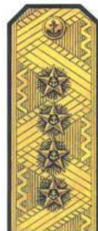
Адмирал флота (парадная форма одежды)