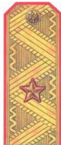
Генерал-майор (парадная форма одежды)