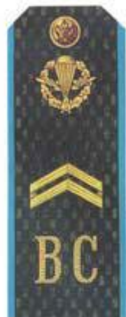
Младший сержант (ВДВ)