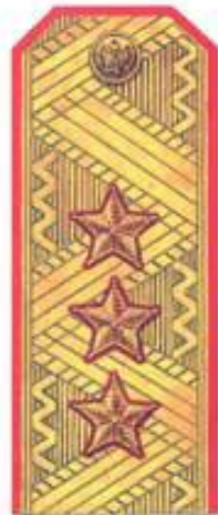
Генерал-полковник (парадная форма одежды)