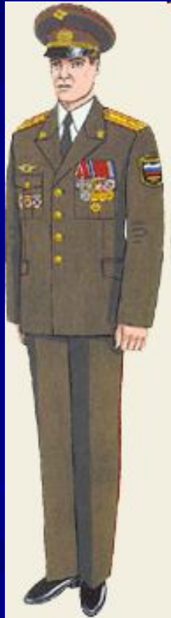
Парадная для строя и вне строя