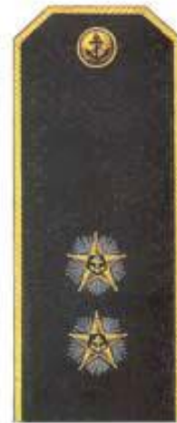
Вице-адмирал (повседневная форма одежды)