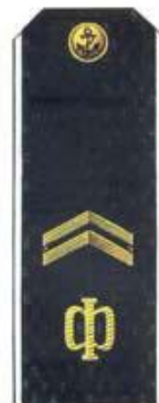
Старшина 2 статьи