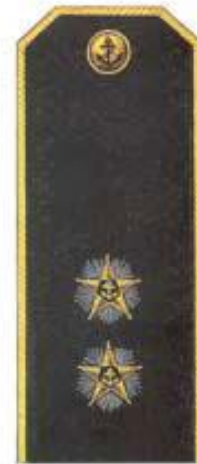
Вице-адмирал (повседневная форма одежды)