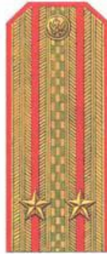
Подполковник (парадная форма одежды)