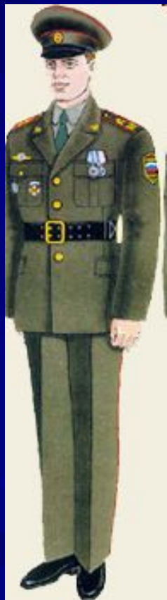
парадная для строя