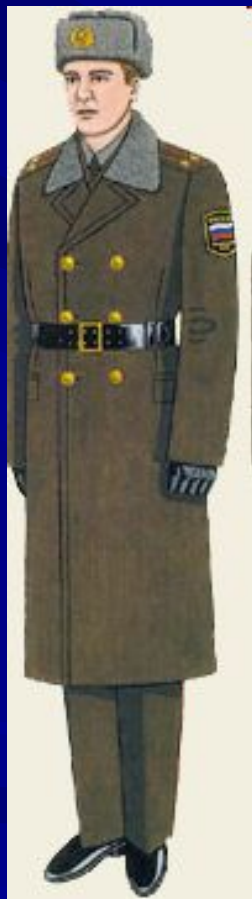
Повседневная для строя