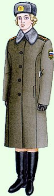
Зимняя повседневная вне строя (кроме ВМФ)