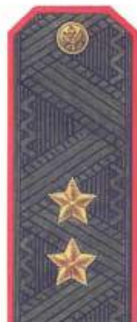
Генерал-лейтенант (повседневная форма одежды)