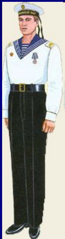
парадная для строя и вне строя