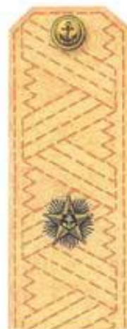
Контр-адмирал (повседневная форма одежды)