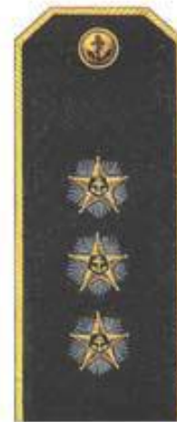
Адмирал (повседневная форма одежды)