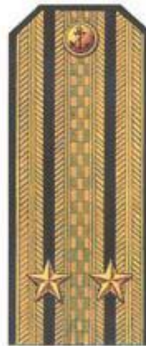
Капитан 2 ранга (парадная форма одежды)