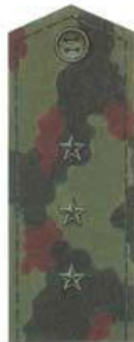
Старший прапорщик (полевая форма одежды)