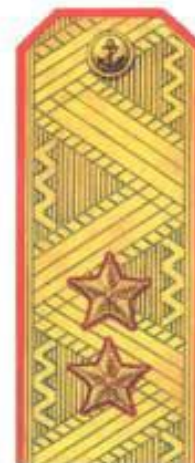
Генерал-лейтенант (парадная форма одежды, береговые войска)