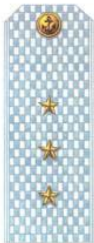
Старший мичман (парадная форма одежды, ВМФ)