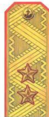
Генерал-лейтенант (парадная форма одежды, береговые войска)