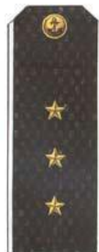
Старший мичман (повседневная форма одежды, ВМФ)