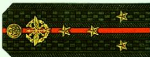
Капитан (повседневная форма одежды)