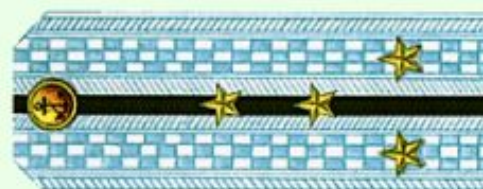
Капитан-лейтенант (парадная форма одежды, ВМФ)