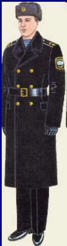
парадная для строя и вне строя