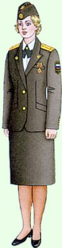
Летняя парадная для строя и вне строя (кроме ВМФ)