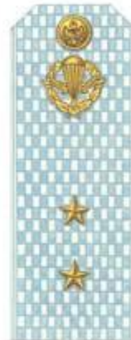
Прапорщик (парадная форма одежды, ВДВ)