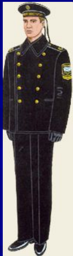
парадная вне строя курсантов