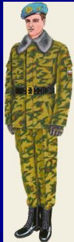
парадная для строя повседневная и вне строя ВДВ