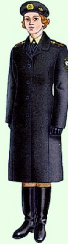
Зимняя повседневная вне строя в береговых войсках ВМФ