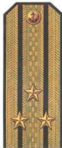
Капитан 1 ранга (парадная форма одежды)