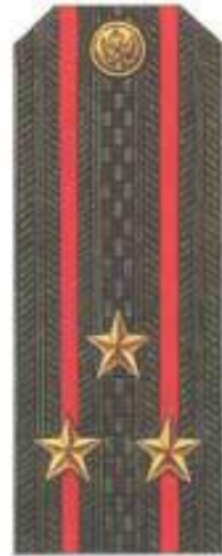
Полковник (повседневная форма одежды)