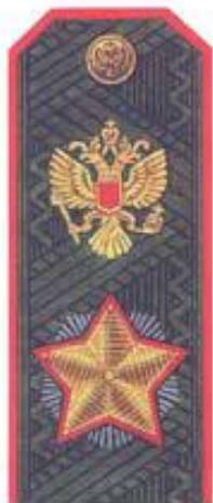
Маршал Российской Федерации (повседневная форма одежды)