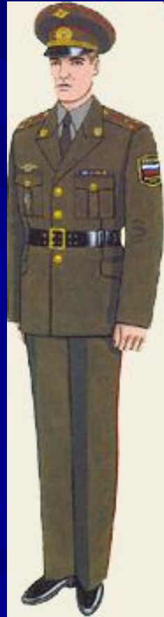
Повседневная для строя