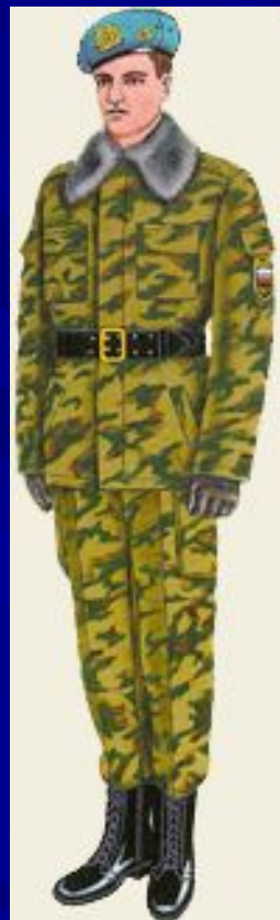
парадная для строя повседневная и вне строя ВДВ