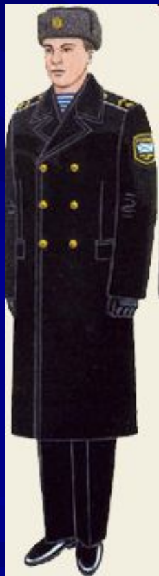
парадная вне строя