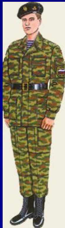
повседневная для строя и вне строя