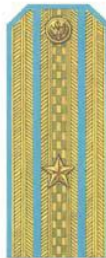
Майор (парадная форма одежды, ВВС, ВДВ)