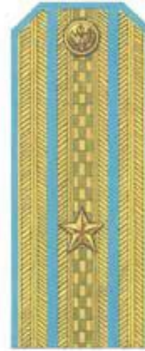
Майор (парадная форма одежды, ВВС, ВДВ)