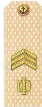
Старшина 1 статьи