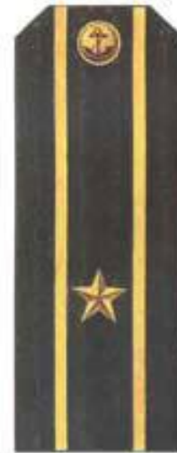
Капитан 3 ранга (повседневная форма одежды)