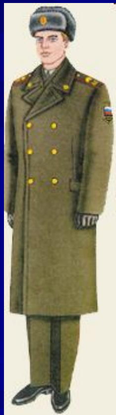
парадная вне строя