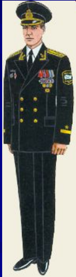
парадная для строя и вне строя