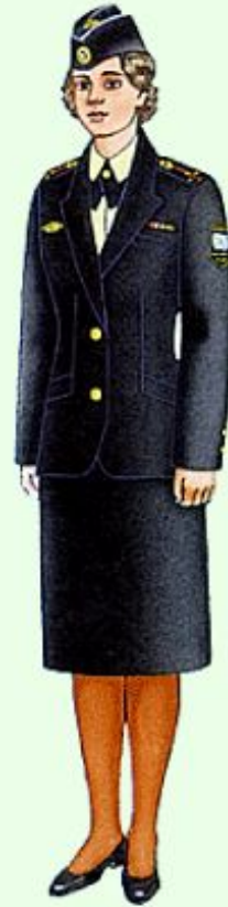
Летняя повседневная вне строя в ВМФ