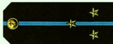
Старший лейтенант (повседневная форма одежды, морская авиация)