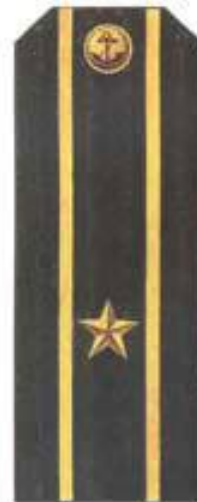
Капитан 3 ранга (повседневная форма одежды)