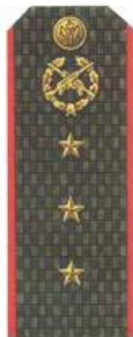
Старший прапорщик (повседневная форма одежды)