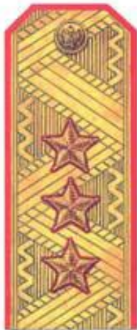
Генерал-полковник (парадная форма одежды)