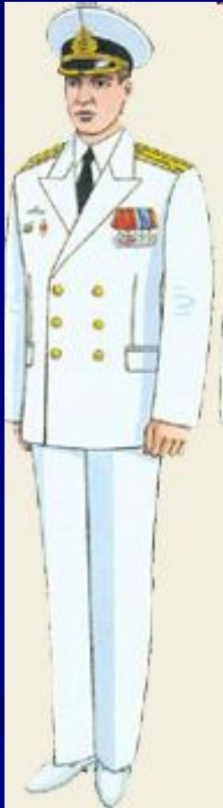
парадная для строя и вне строя