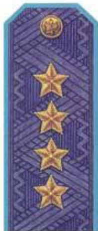
Генерал армии (повседневная форма одежды, ВВС)