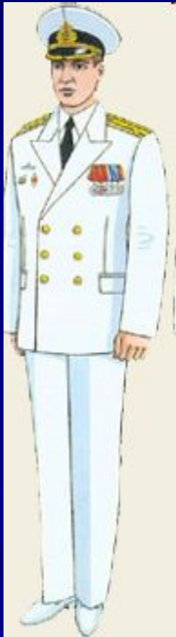
парадная для строя и вне строя