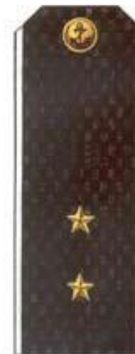
Мичман (повседневная форма одежды, ВМФ)