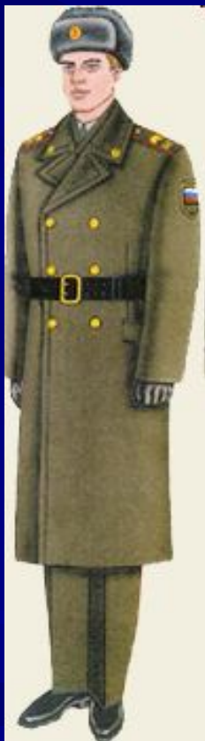
парадная для строя