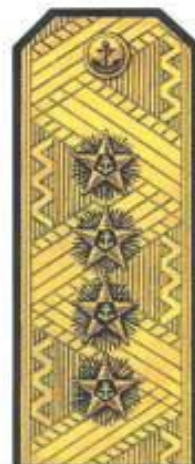
Адмирал флота (парадная форма одежды)