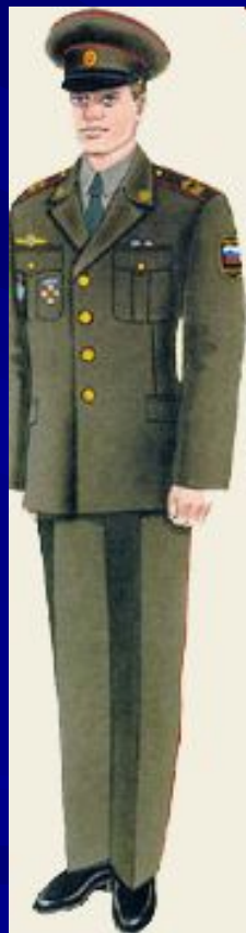
парадная вне строя