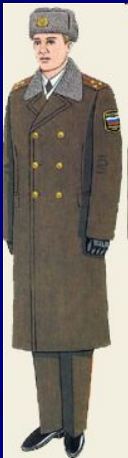
Парадная для строя и вне строя