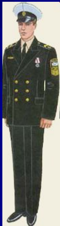
парадная вне строя курсантов