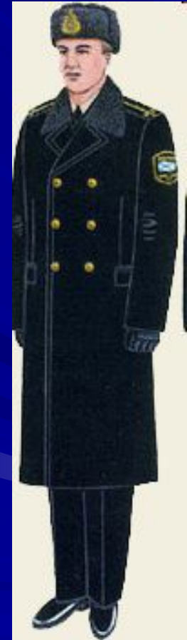
повседневная для строя и вне строя