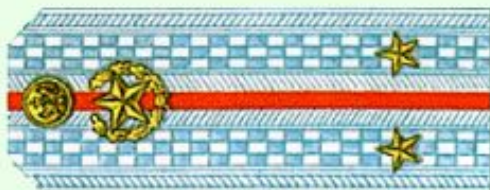
Лейтенант (парадная форма одежды)