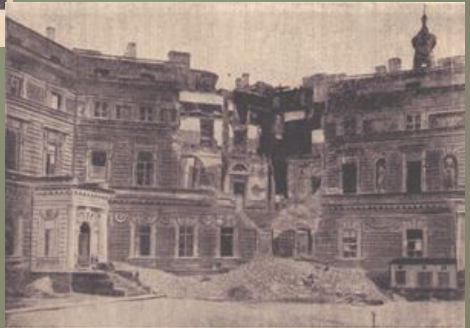
Иннерепный залок, разрушенный 4 апреля 1942 г. фугасной бомбой