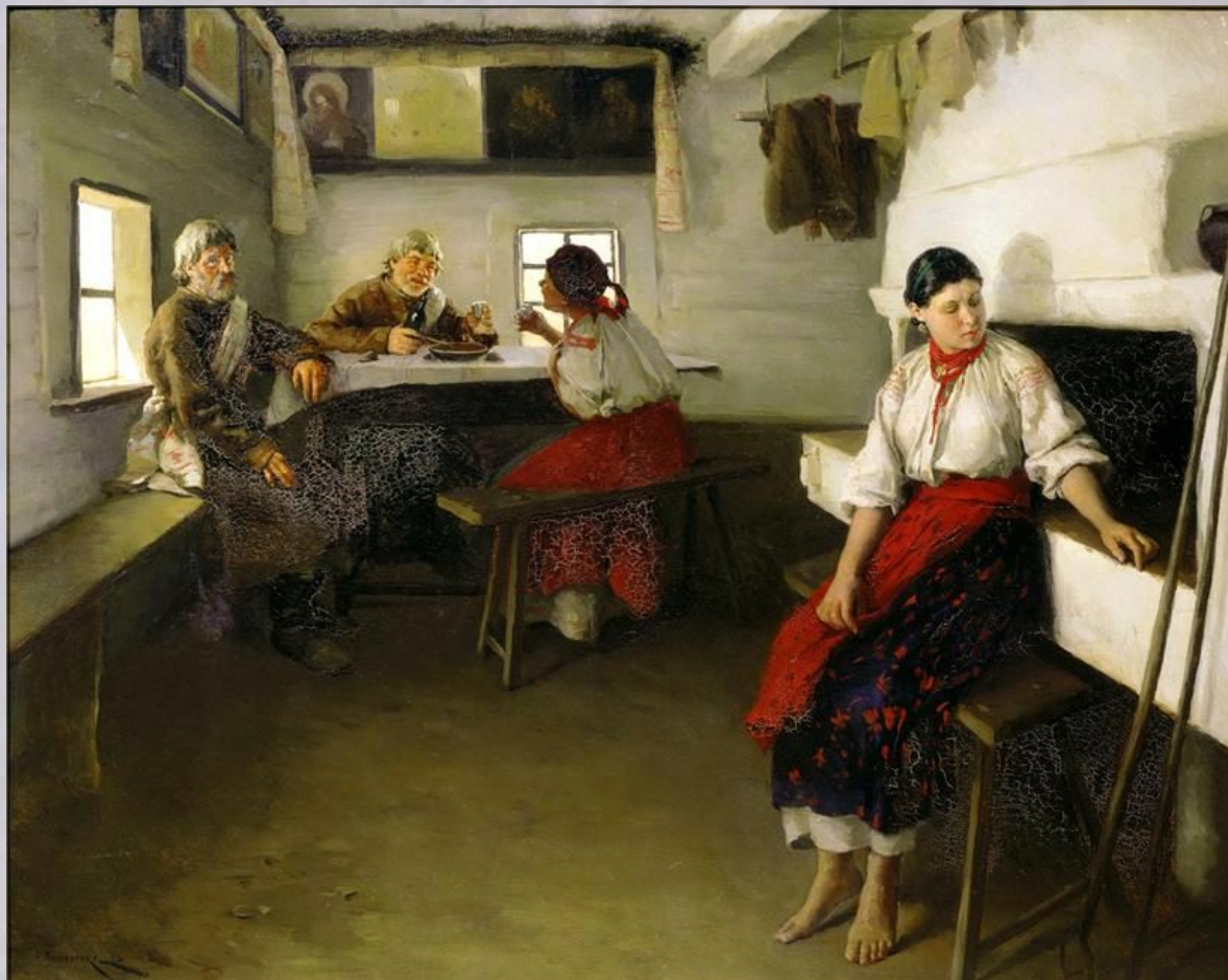
ПИМОНЕНКО Николай Сваты