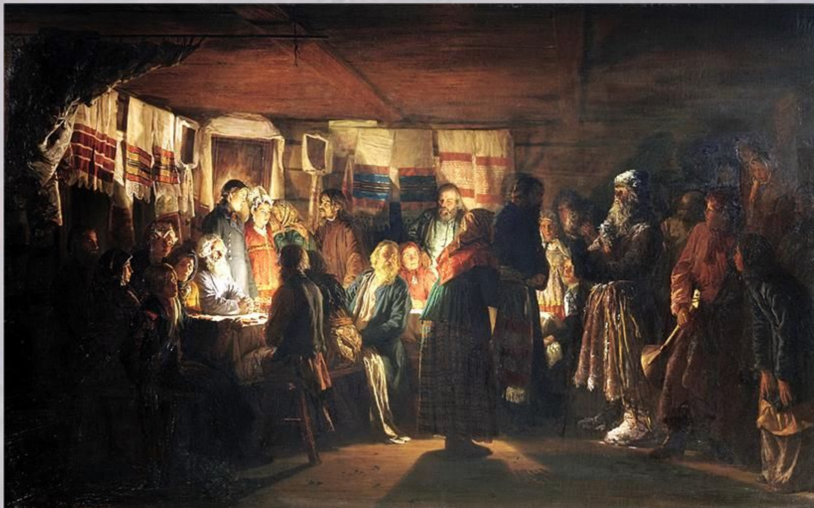
МАКСИМОВ Василий Приход колдуна на крестьянскую свадьбу