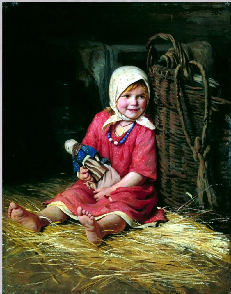
ЛЕМОХ Карл Варька