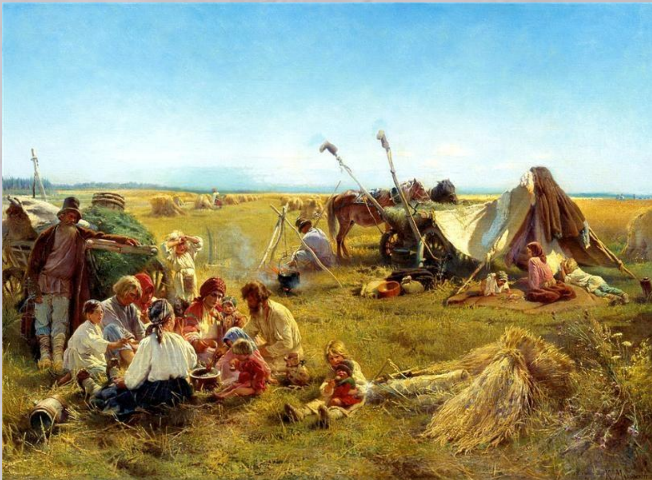
МАКОВСКИЙ Константин Крестьянский обед в поле