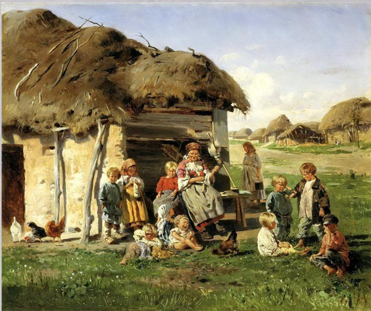
МАКОВСКИЙ Владимир - Крестьянские дети