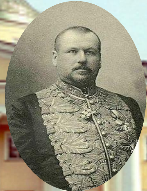
М.В. Родзянко (октябрист) с 22 марта 1911 г. по 9 июня 1912 г.