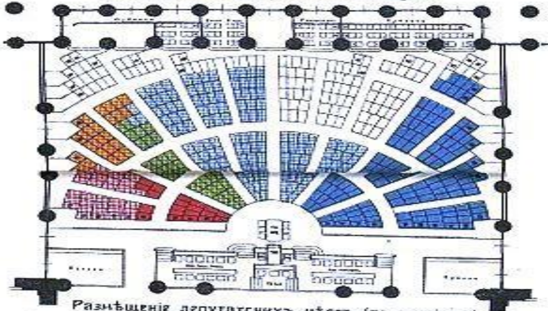
Размѣщеніе депутатскихъ мѣстъ (по партіямъ).