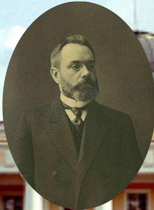
А.И. Гучков (октябрист) с 29 октября 1910 г. по 14 марта 1911 г.