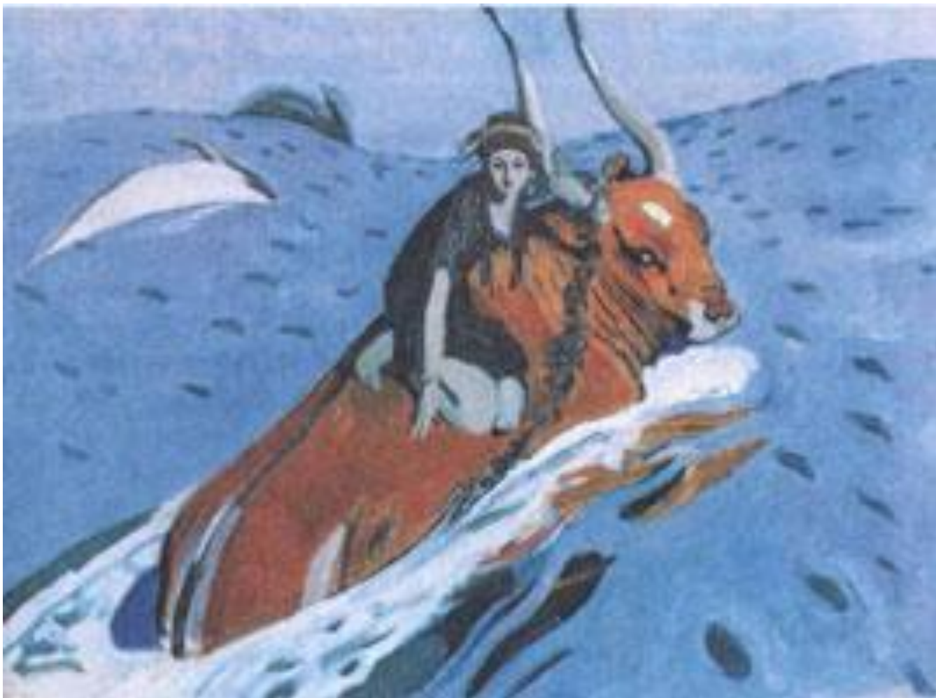
Похищение Европы Валентин Серов, 1910 г. Москва, Третьяковская галерея