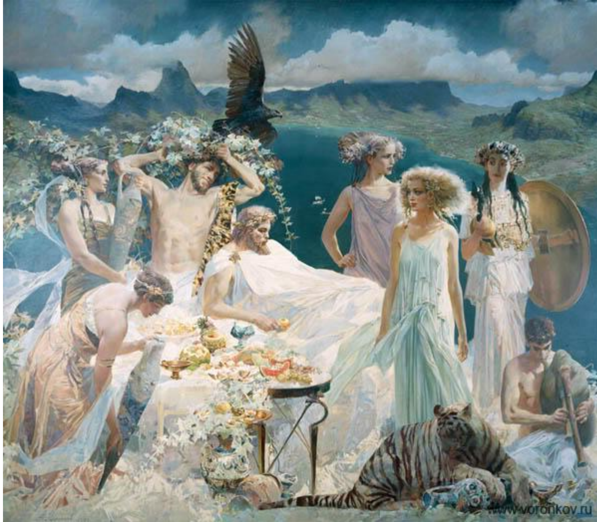
А.Воронков. ЯБЛОКО РАЗДОРА .1999