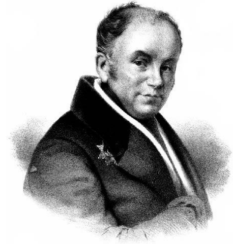
Василий Жуковский (1783-1852) Переводчик Гомера в России В 1842 г издал лучший перевод «Одиссеи»