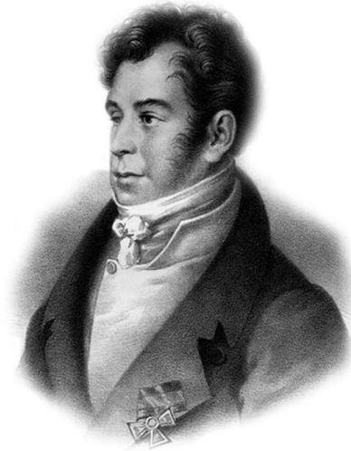
Николай Гнедич (1784-1833) Первый переводчик Гомера в России. В 1829г. издал лучший перевод «Илиады»