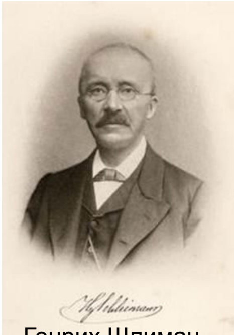
Генрих Шлиман (1822-1890) немецкий археолог. Большую часть жизни посвятил изучению жизни Гомера и раскопкам Трои, Микен, Орхомена, Тирифа