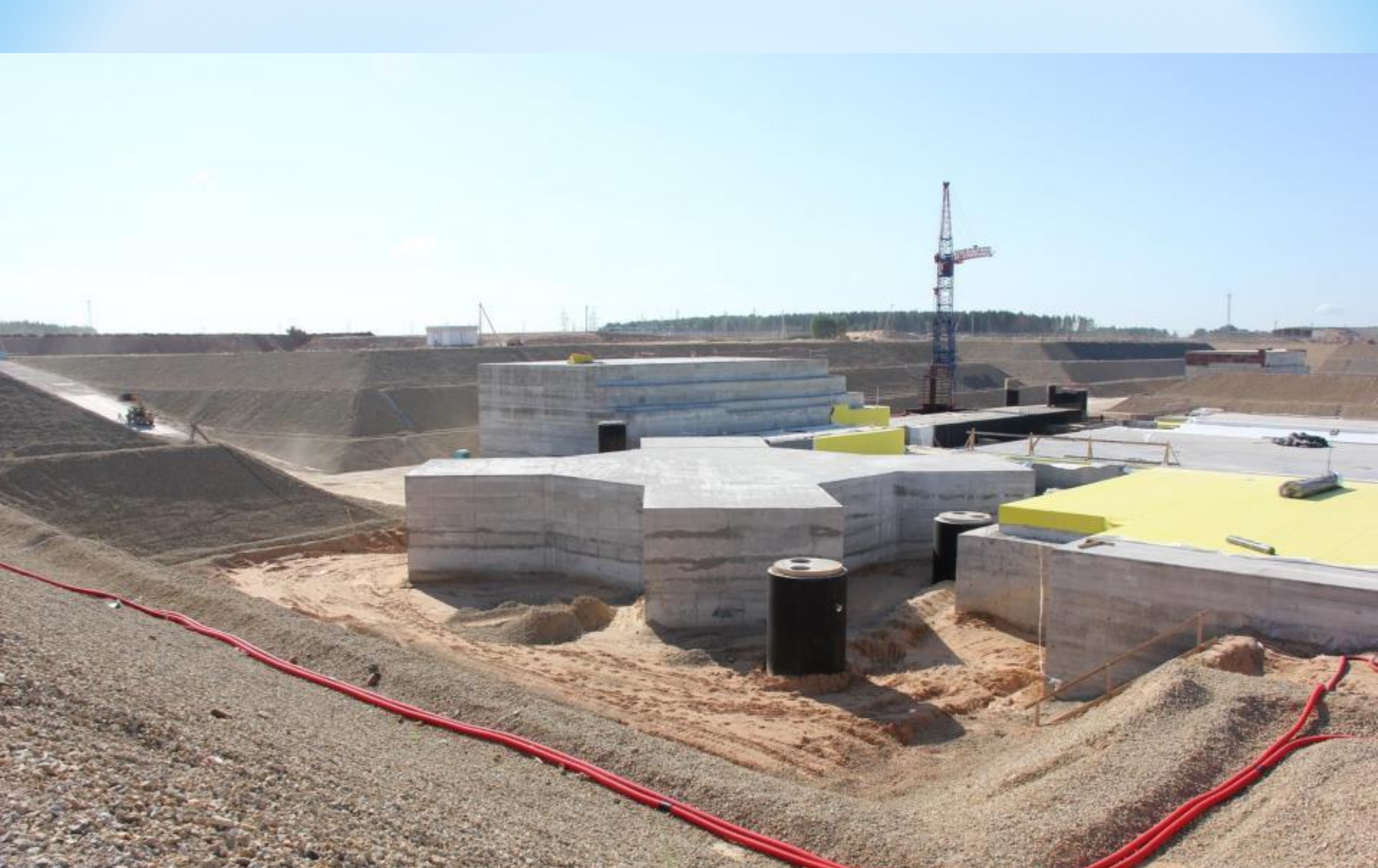
Июль, 2013 г.