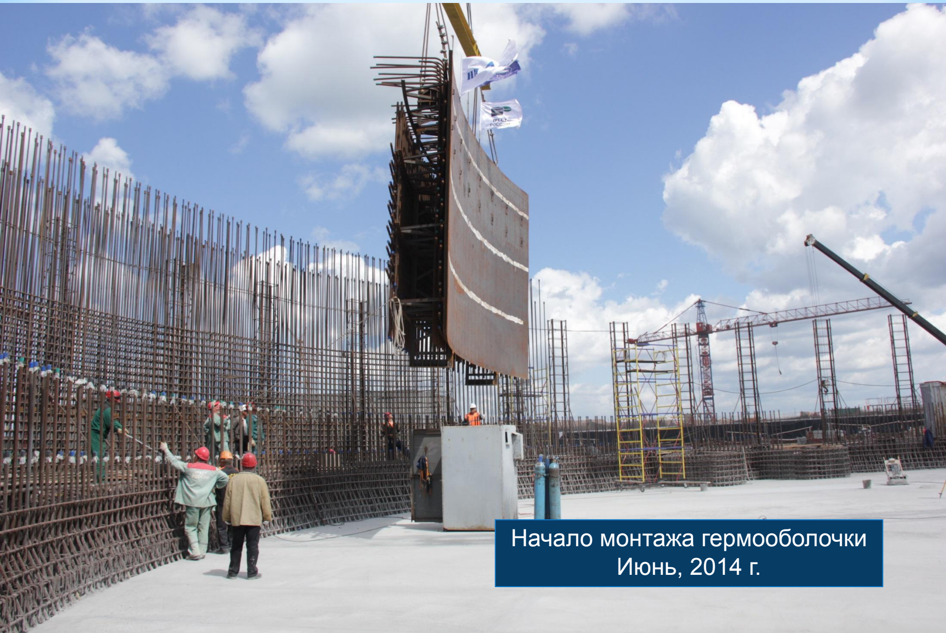
Начало монтажа гермооболочки Июнь, 2014 г.