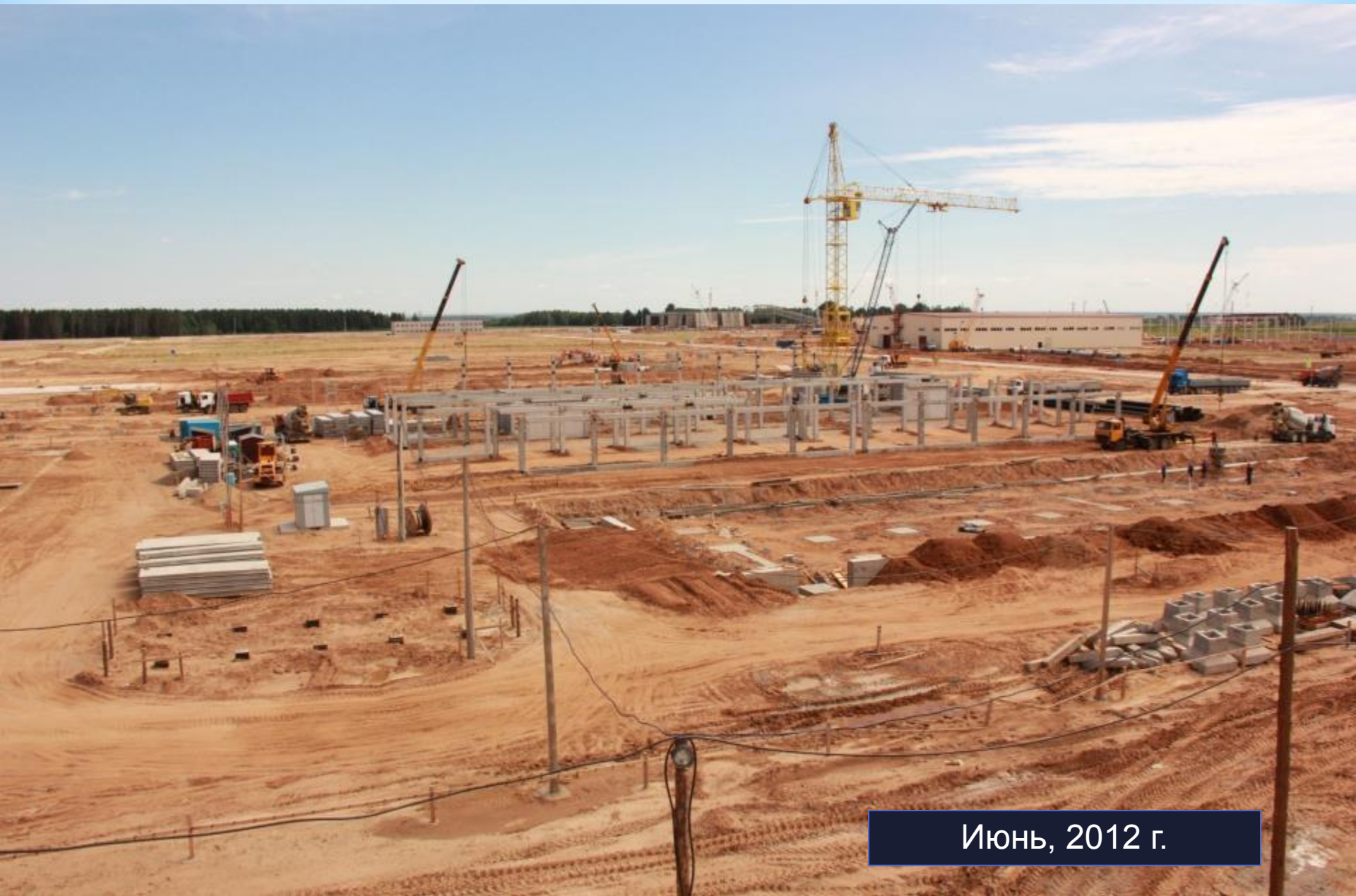
Июнь, 2012 г.