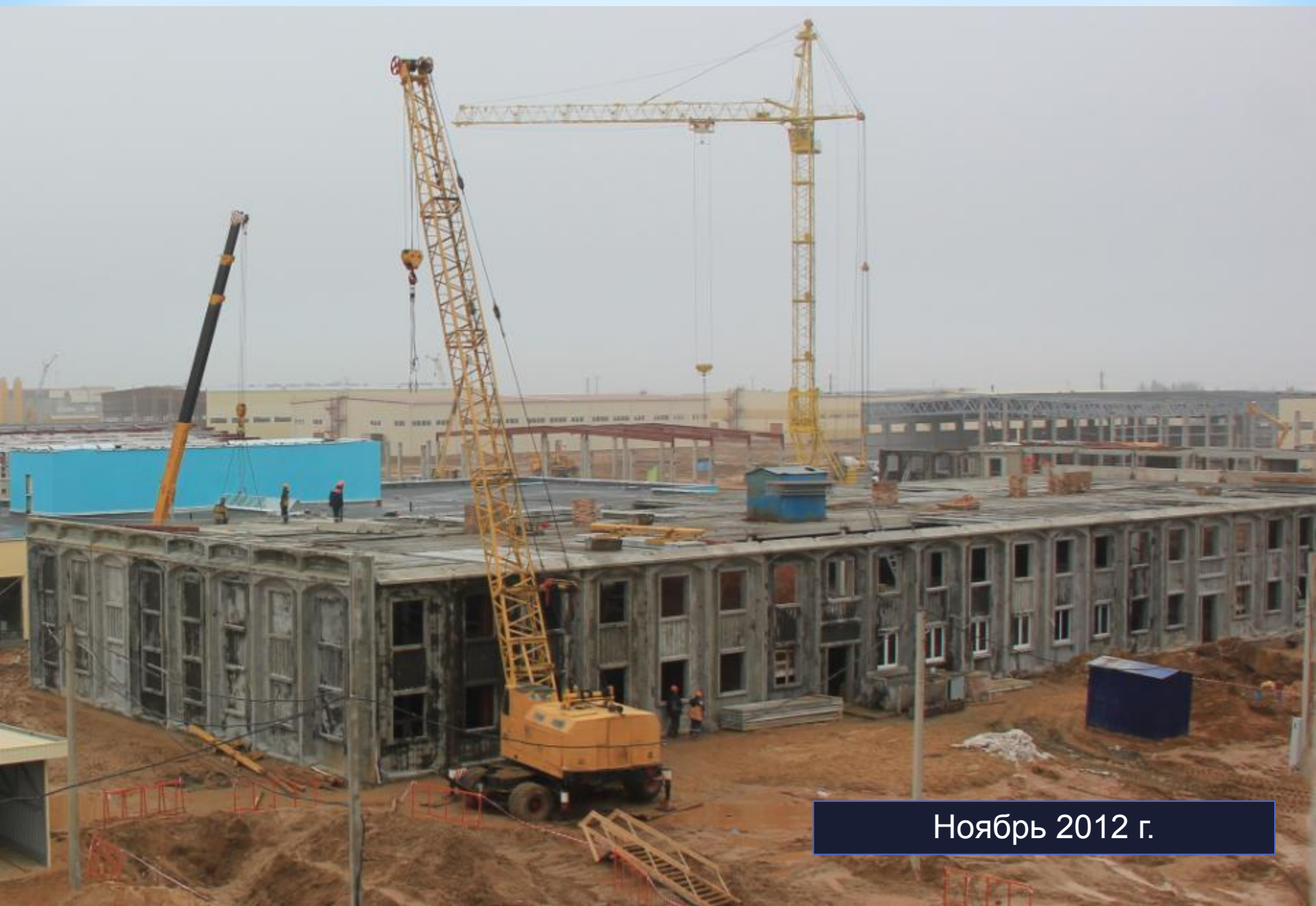
Ноябрь 2012 г.