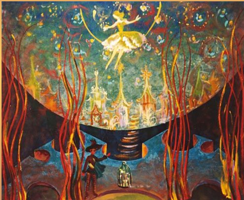
Эскиз декораций к опере «Волшебная флейта»