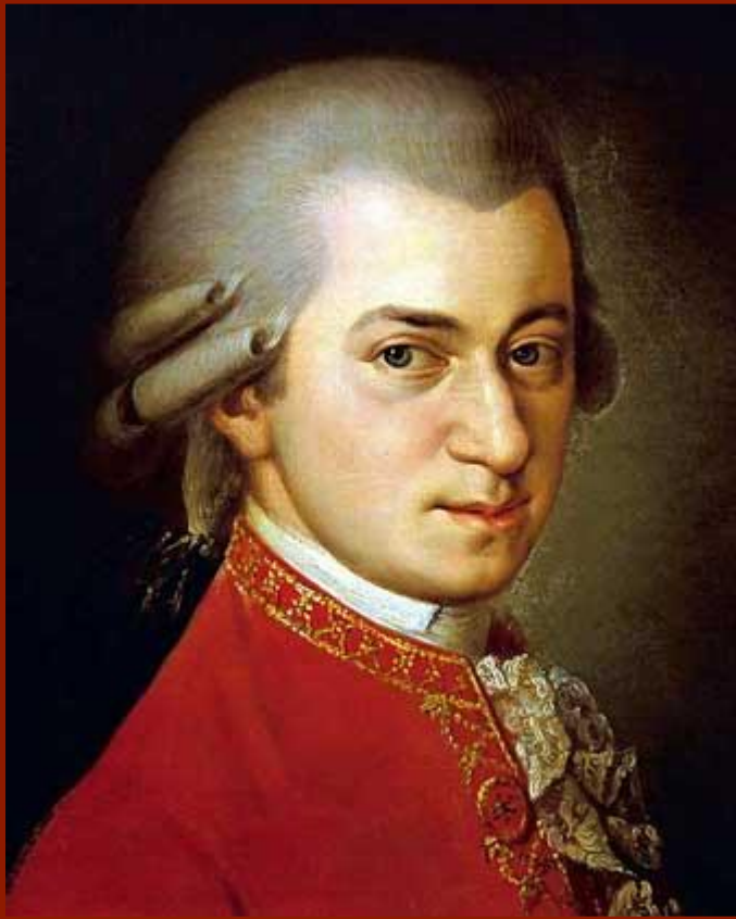
Б.Крафт. Портрет Моцарта. 1814 г.