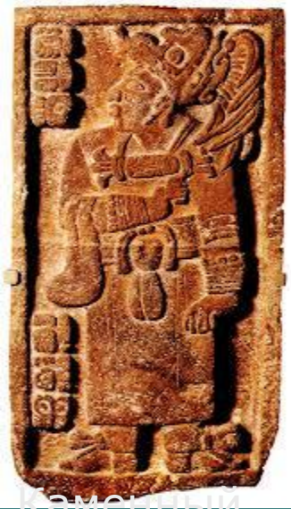
Каменный рельеф подэного периода в искусстве майя