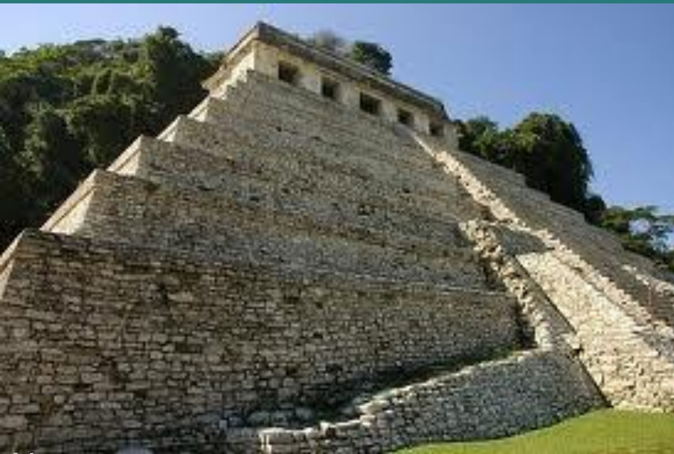
Храм в Паленеке.