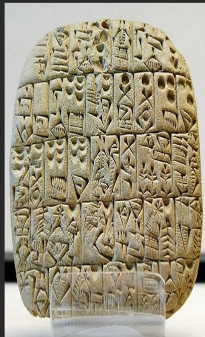
Глиняная табличка из Шуруппака, ок. 2600 г. до н.э.