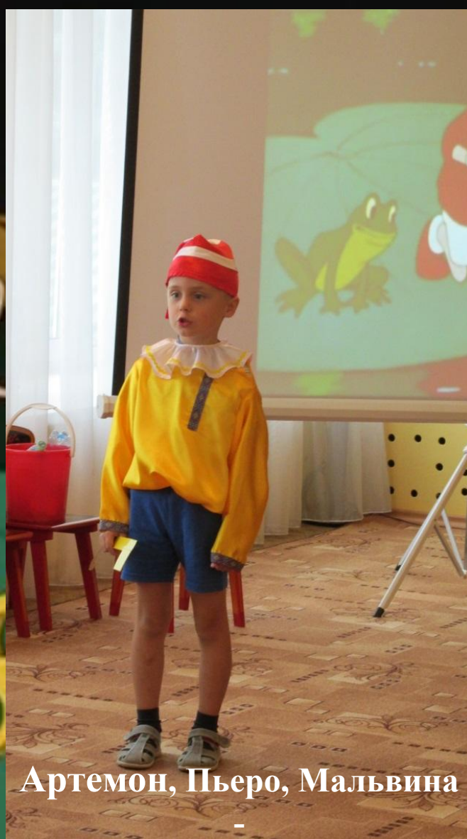
Артемон, Пьеро, Мальвина

Дружат все они со мной, Всюду нос сую я длинный, Моё имя . . .