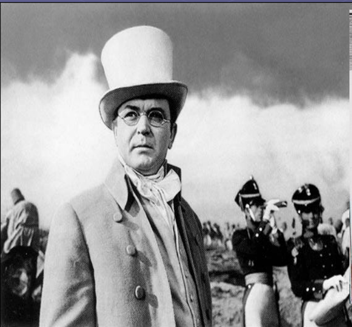
Пьер Безухов(в роли-С.Бодарчук)