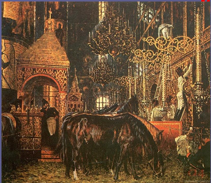
В Успенском Соборе