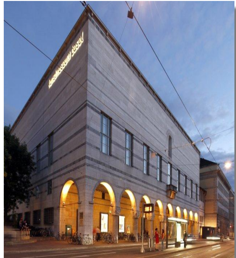
Kunstmuseum Basel ist grösstes Kunstmuseum der Schweiz