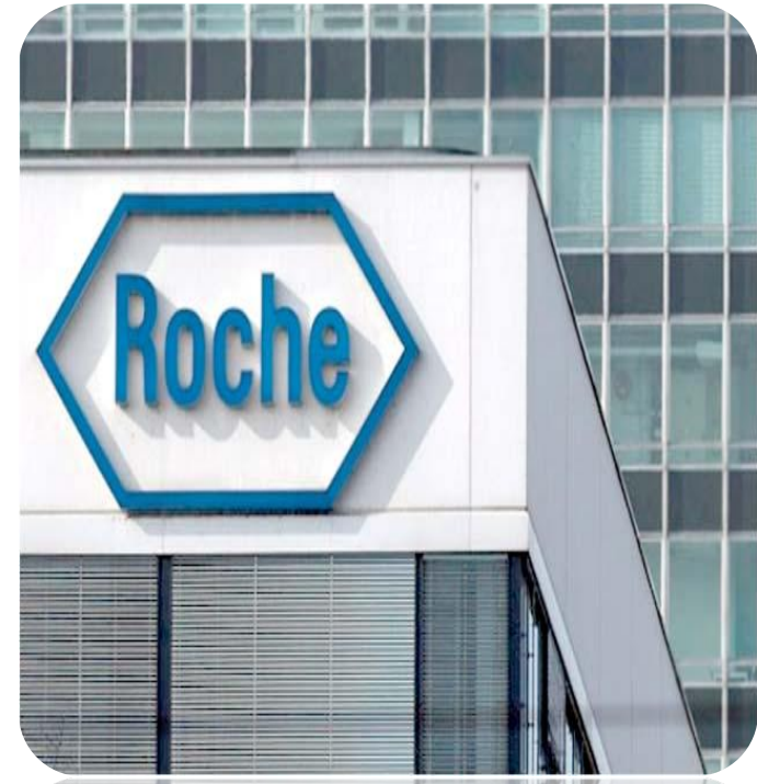
Novartis International AG