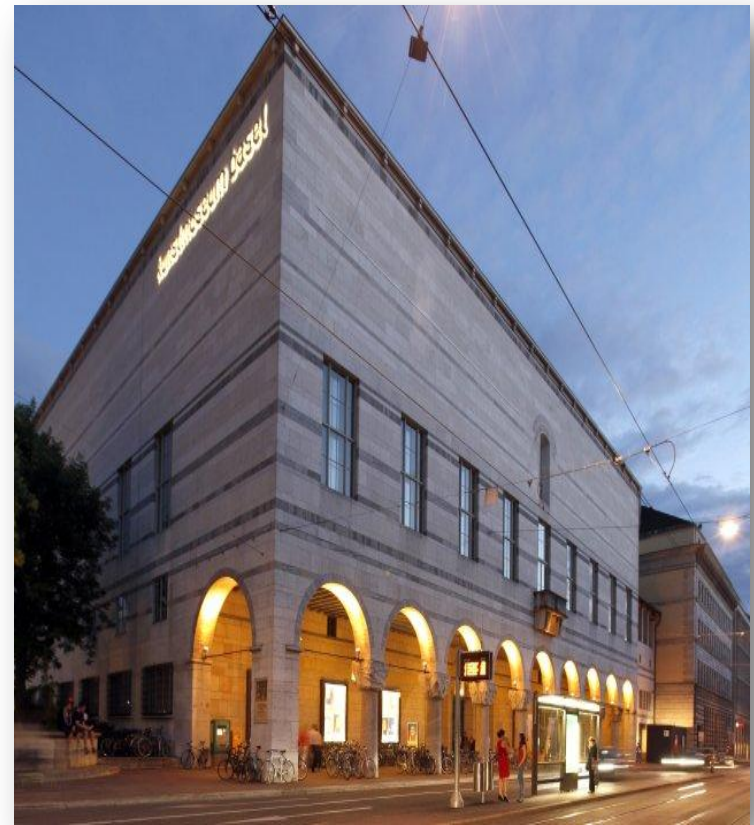
Kunstmuseum Basel ist grösstes Kunstmuseum der Schweiz