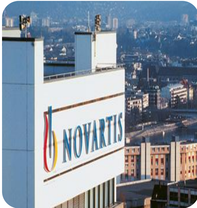
Hoffmann-la roche ltd

Basel ist ein Zentrum der Chemie- und Pharmaindustrie