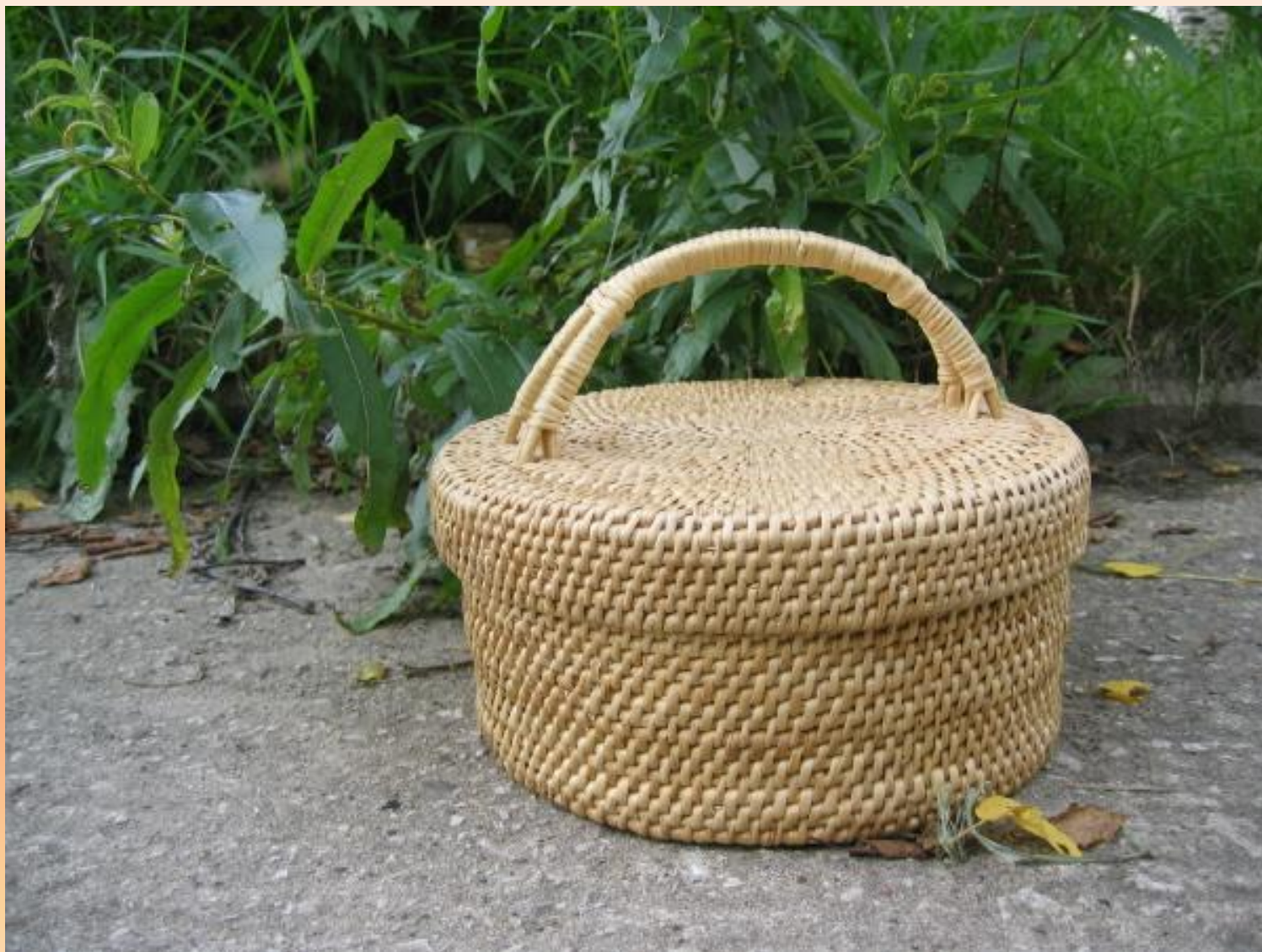
«Короб с крышкой»