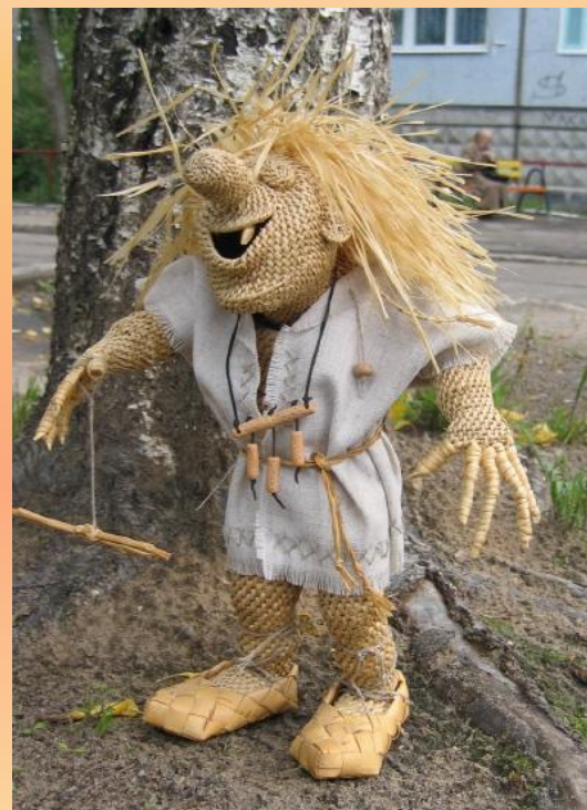
«Лошадка», «Медвежонок» «Домовой»