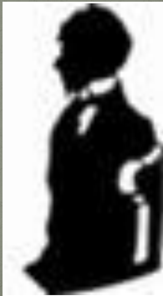
Силуэт работы Е. Кругликовой