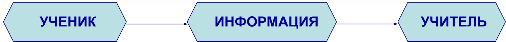
Схема образовательной парадигмы

Исходя из этой цели, необходимо решить следующие задачи: