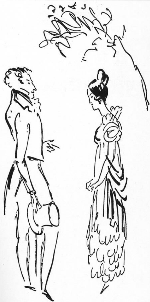
Татьяна и Онегин.