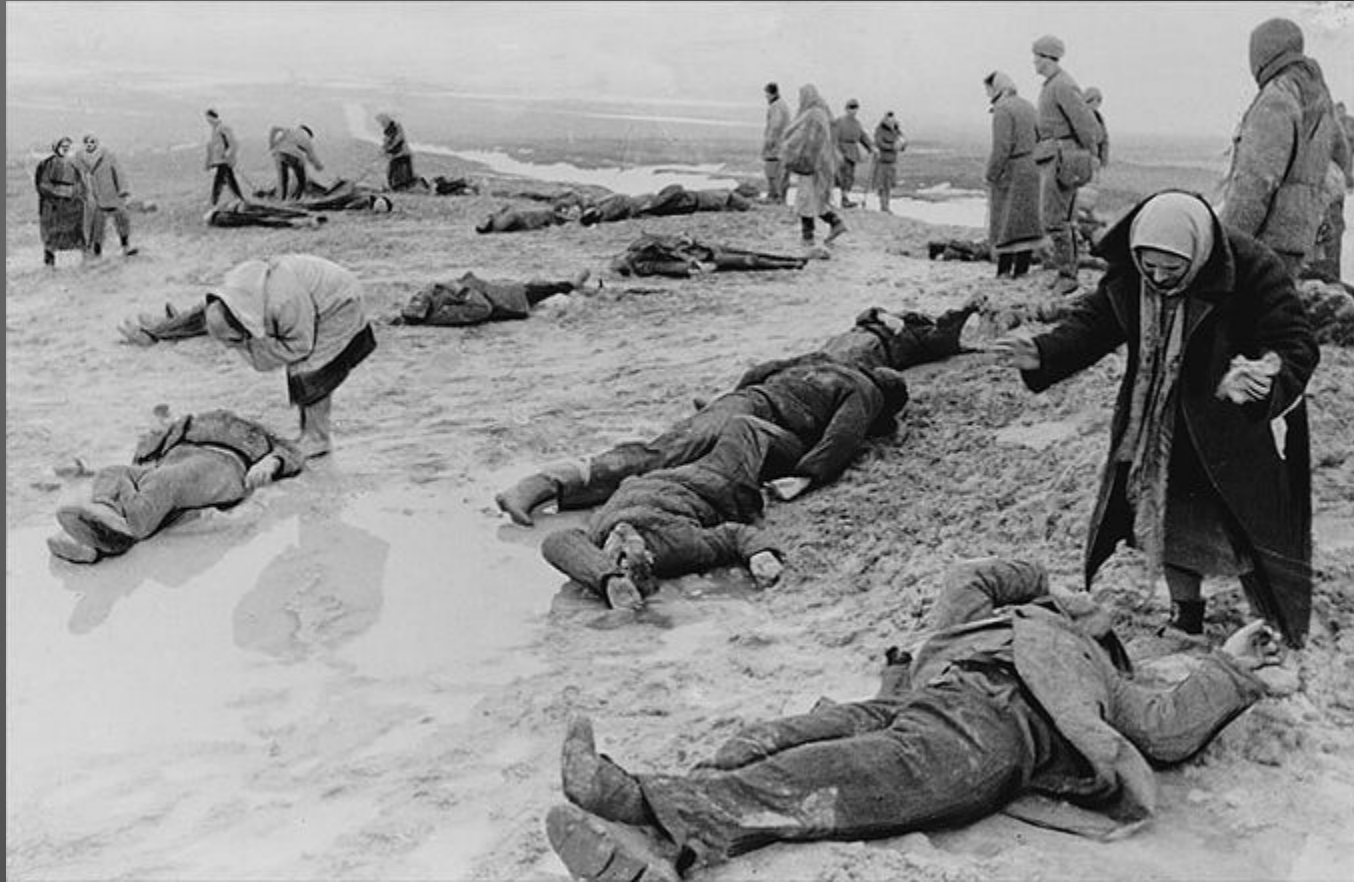
Расстрелянные фашистами мирные советские люди.