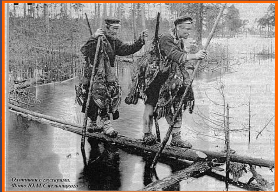
Охотники с глухарями.