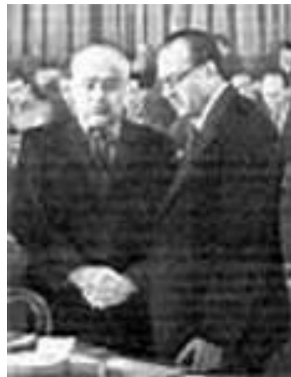
Первый президент ГДР О. Гротеволь и В.Пик

провозглашение создания Германской Демократической Республики на территории Восточной Германии.