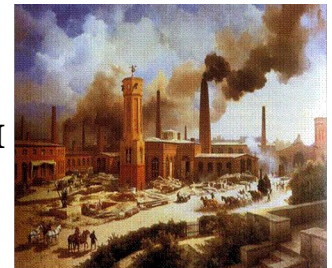
Fig. 1. Imagen de la Revolución Industrial en Alemania. (Revolución, /a/).