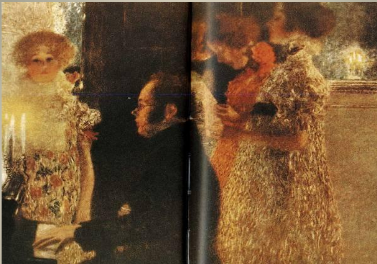
«Шуберт за пианино» Густав Климт (1862 – 1918)