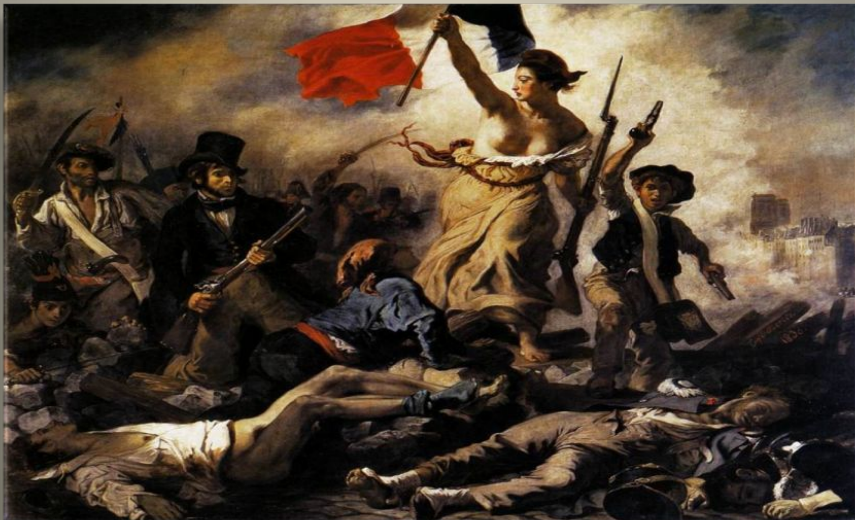
Делакруа «Свобода на баррикадах»