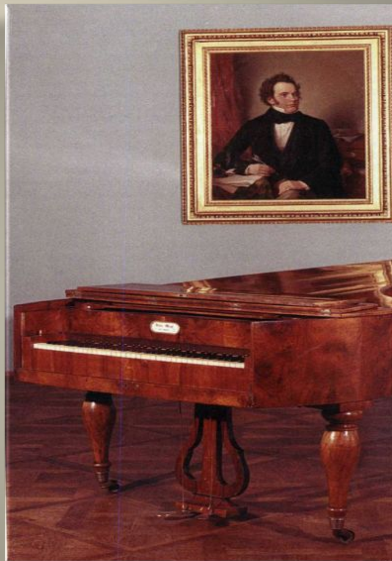
Рояль Франца Шуберта

«Что за неисчерпаемое богатство мелодического изобретения было в этом безвременно окончившим свою карьеру композиторе! Какая роскошь фантазии и резко очерченная самобытность». П.И. Чайковский о Шуберте