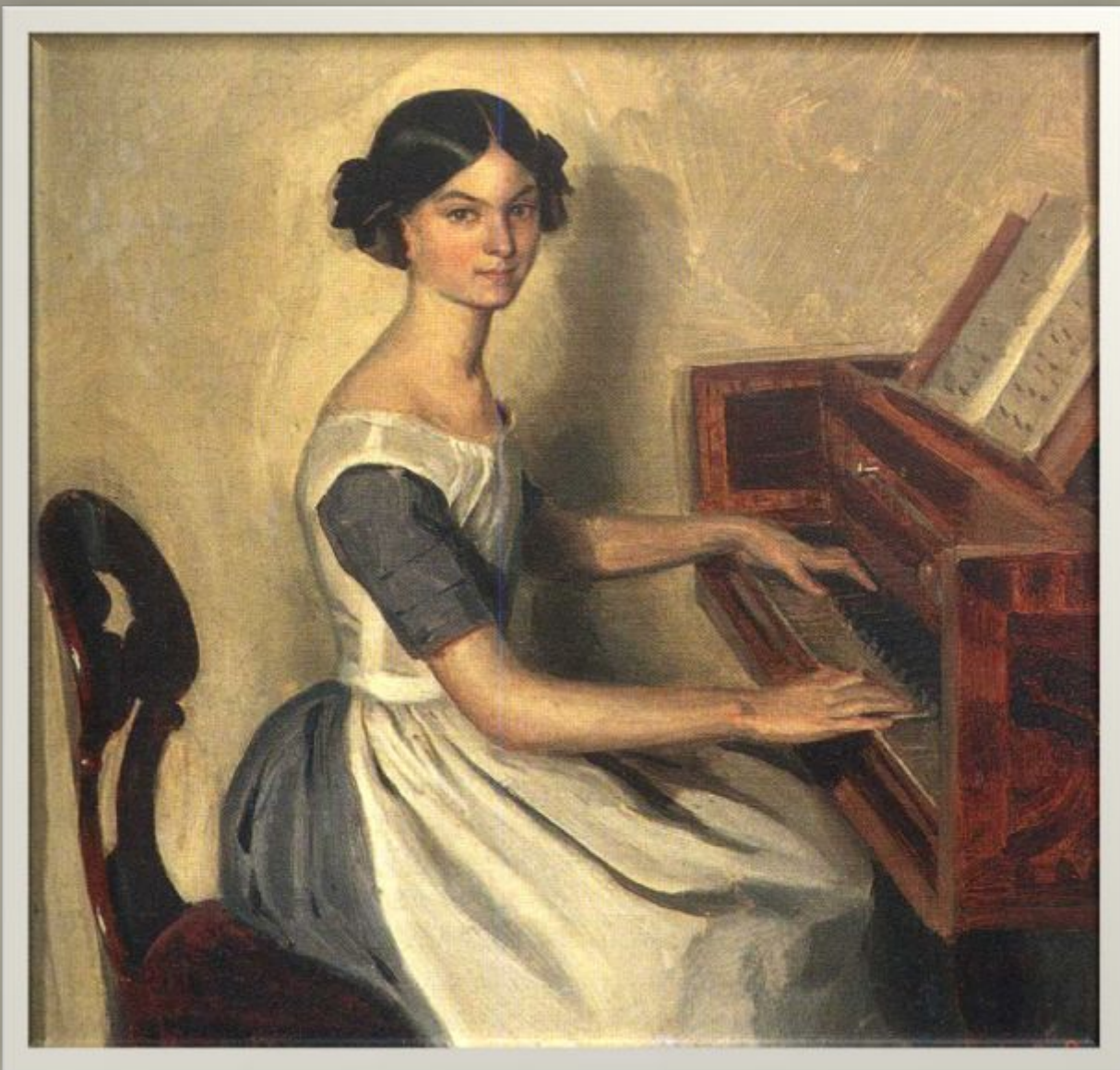
Павел Федотов «Девушка за фортепьяно»