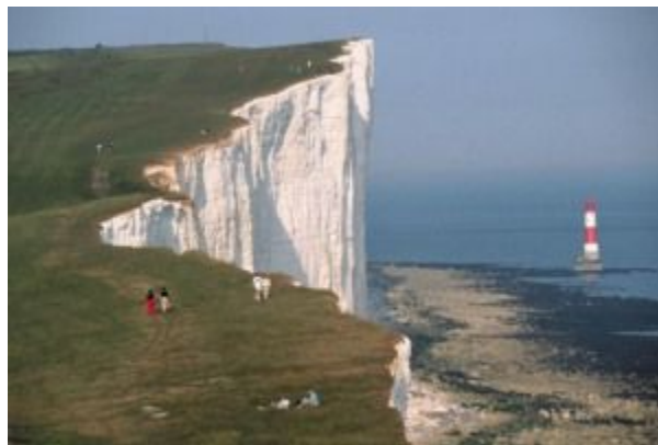
The White Cliffs of Dover are cliffs which form part of the British coastline facing the Strait of Dover and France.

The UK is separated from the continent by (9) the English Channel and (10) the Strait of Dover. The nearest point to (11) Europe is the Strait of Dover. The UK is also washed by (12) the Atlantic Ocean in the north and (13) the North Sea in the east.