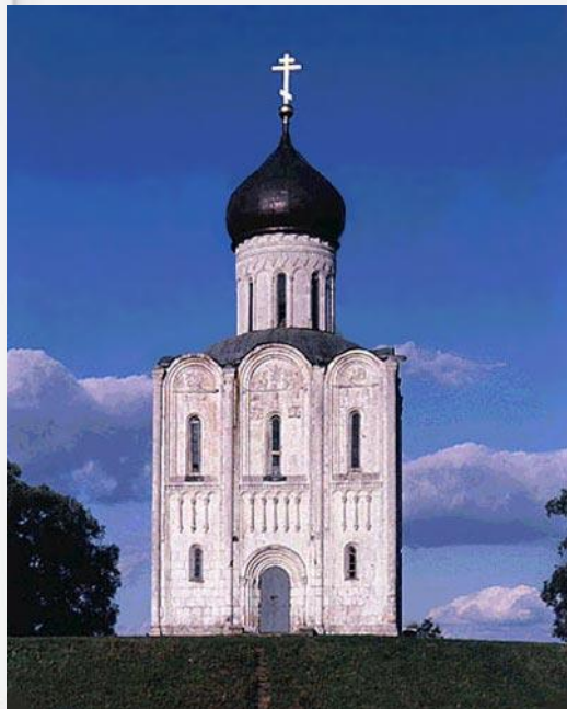
Собор Покрова на Нерли, 60-е XII века Влад.обл.

Церковь Покрова Богородицы на Нерли. Уже более восьмисот лет стоит в суздальской земле, на берегу Нерли, церковь Покрова Богородицы. В ясные летние дни, при безоблачном небе, среди зелени обширного заливного луга ее стройная белизна, отраженная гладью небольшого озера, дышит поэзией и сказкой. В суровые зимы, когда все вокруг бело, она словно растворяется в бескрайнем снежном море. Храм настолько созвучен настроению окружающего пейзажа, что кажется, будто он родился вместе с ним, а не создан руками человека. Не зря для нее и посвящение выбрано Покрову. Покров есть защита и покровительство, русским людям надежда и милость, от врагов укрытие и оберег.