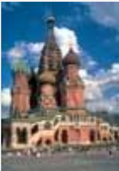
Храм Покрова на рву зодчие Барма, Постник 1555-1561 Москва

Когда русские войска взяли Казань и прочно утвердились на волжских берегах, повелел царь Иван Грозный поставить у стен московского Кремля церковь о восьми главах — по числу одержанных побед. Недавно возвратился он из похода, с великим ликованием встречала его Москва: звонили колокола, люди со смехом и рыданиями бросали праздничные одежды под копыта царского коня: у многих родные и близкие томились в ордынском плену. Любимая супруга Анастасия Романовна разрешилась от бремени наследником — это тоже был праздник. Летопись гласит: "...царь и великий князь Иван Васильевич... повеле поставити храм Покрова с пределы о Казанской победе, что бог покорил безсерманский род казанских татар царю...". Увековечить эту победу поручили гениальным зодчим Барме и Постнику. Ходят легенды, что после окончания строительства царь велел выколоть глаза архитекторам, чтобы они больше ничего подобного построить не смогли.