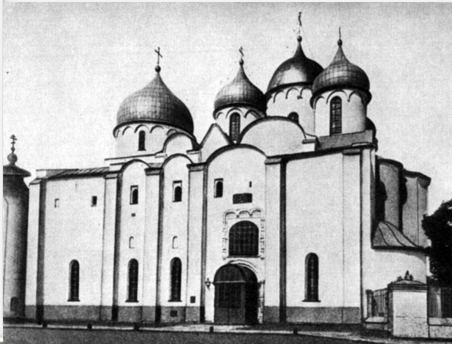
Собор Святой Софии в Новгороде 1045-1052 Новгород

Новгородский собор св.Софии. Ярослав Мудрый до конца жизни своей был благодарен новгородцам, посадившим его на киевский престол. Дал он им в князя любимого своего сына — Владимира, а когда тот с новгородской дружиной по отцовскому приказу разбил волжских болгар и захватил богатую добычу, Ярослав не поскупился: все отдал Новгороду. И решили новгородцы возвести у себя Новгородский Софийский собор, увенчанный пятью главами. Софию Новгородскую строили семь лет, и освящение ее состоялось в 1052 году. Святой князь Владимир по освящении собора прожил менее месяца, скончался 4 октября 1052 года и похоронен был в церкви Святой Софии.