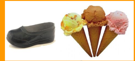
Калоши и мороженое