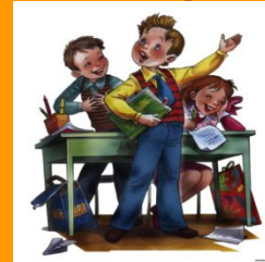
Не надо врать