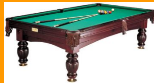
30 лет спустя