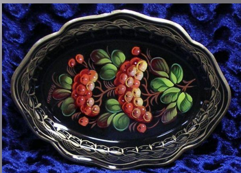
Ветка с угла