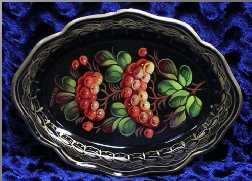
Ветка с угла