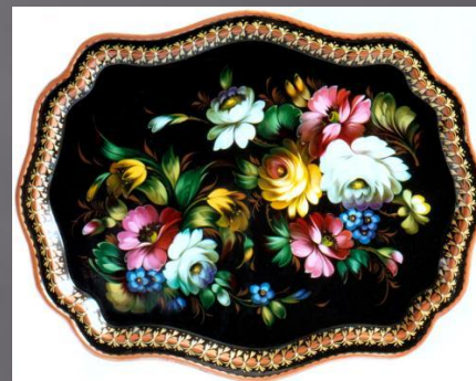
Букет в раскидку