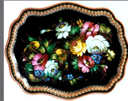
Букет в раскидку