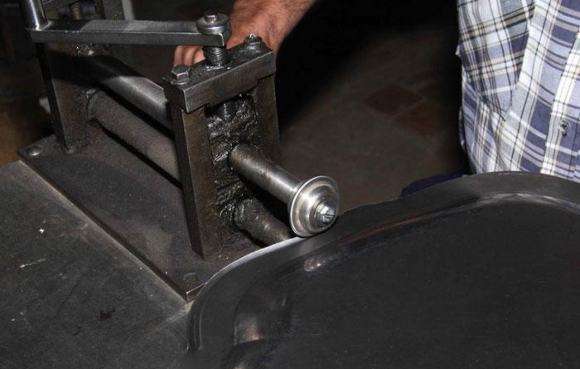
Вытягивание края подноса