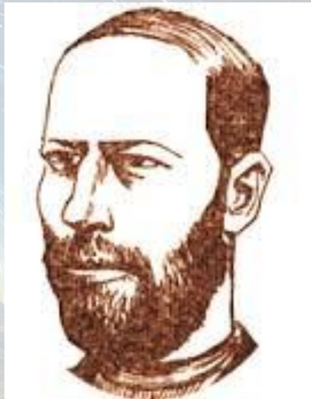
ГЕРЦ ГЕНРИХ (1857-1894)