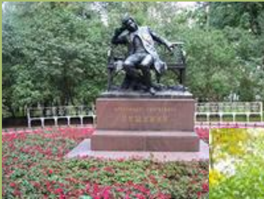
Памятник Пушкину в Царском Селе (ныне город Пушкин).