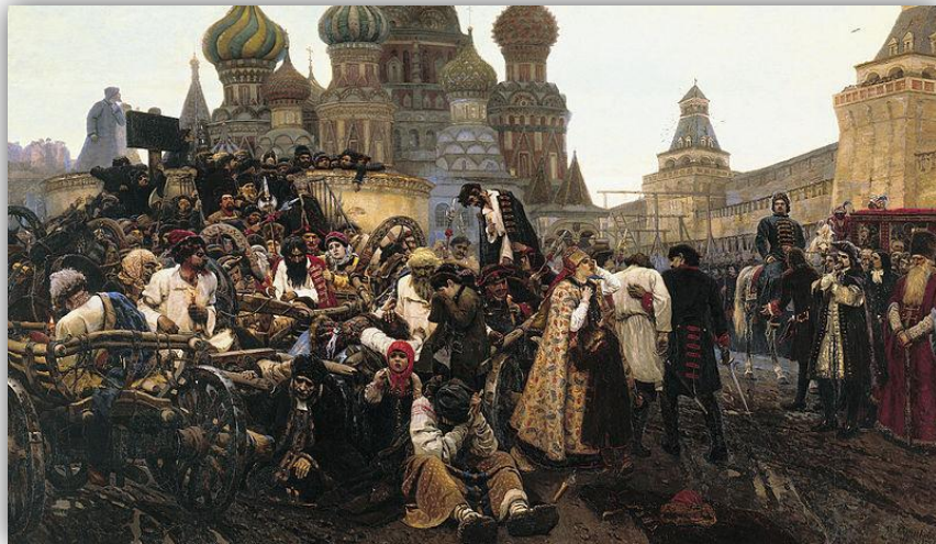
Утро стрелецкой казни