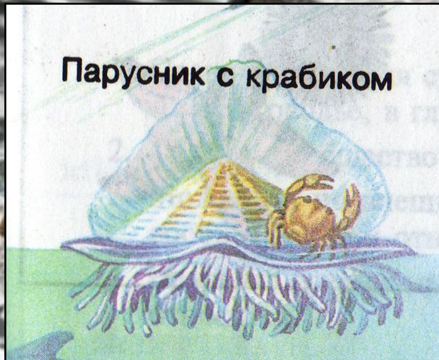
Парусник с крабиком